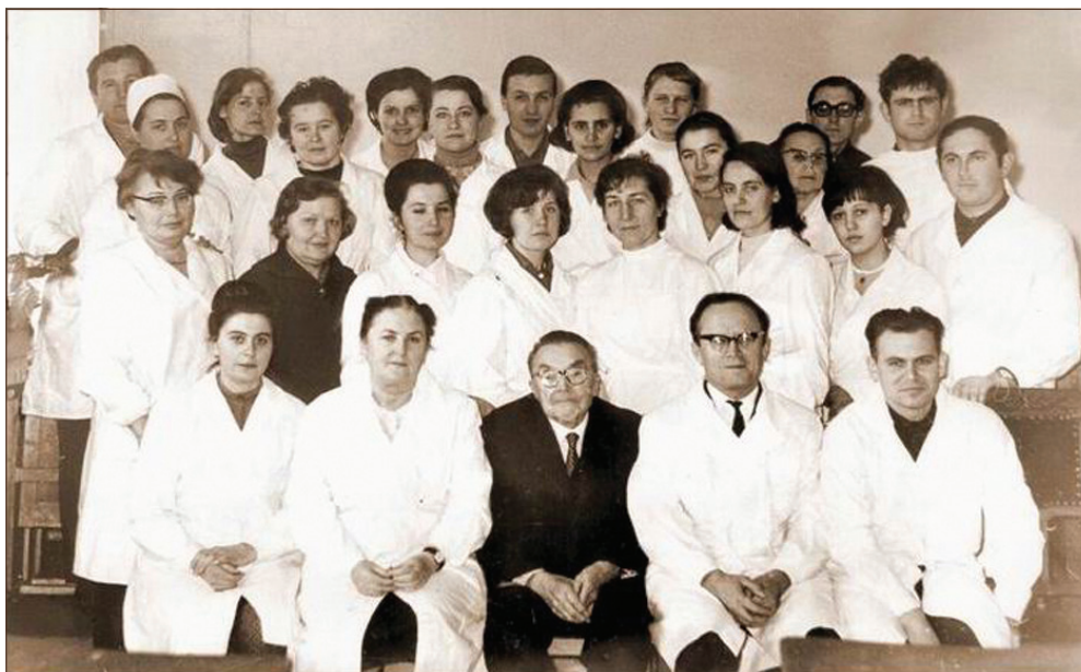
Співробітники відділу біохімії нервової системи (60-і роки)

ченні активності \text{Na}^+\text{-K}^+ - та \text{Mg}^{2+}\text{-Ca}^{2+}\text{-ATP} -аз. Результати таких досліджень, що виконувалися в різні часи на системному, органному, клітинному, субклітинному і молекулярному рівнях, є значним внеском у нейрохімічну науку, в розшифрування біохімічних основ функцій нервової системи, у формування підходів до з'ясування молекулярних механізмів таких специфічних функцій мозку, як пам'ять та психічна діяльність людини. Багаторічні дослідження протеїнів мозку узагальнено в монографії О. В. Палладіна, Я. В. Беліка і Н. М. Полякової «Белки головного мозга и их обмен» (1972 р.), яку було видано також англійською мовою (1977 р.). У світлі зазначених вище проблем функціональної біохімії, рішення яких О. В. Палладін присвятив понад 60 років свого життя, були питання, які мали велике практичне значення, зокрема біохімія сну і психозів.