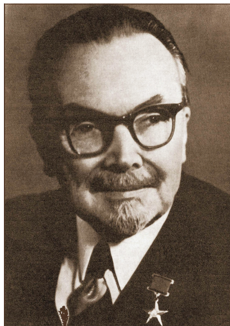
Засновник нейрохімічної науки, Герой Соціалістичної Праці, академік О. В. Палладін (60-і роки)

1960 р. — член делегації АН СРСР на святкуванні 300-річчя Академії наук Великої Британії.