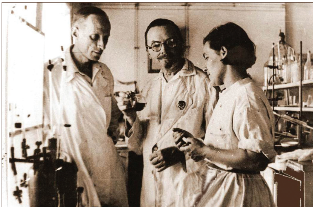
Академік О. В. Палладін зі співробітниками у біохімічній лабораторії Уфимського вітамінного заводу. Уфа, 1942 р.

З початком війни та з наступом фашистів на Київ Інститут біохімії у складі Академії наук УРСР у вересні 1941 р. було евакуйовано до Уфи, де на базі Башкирського санітарно-бактеріологічного та Українського психіатричного інститутів співробітники інституту, які не були призвані до лав Червоної Армії, продовжували роботу під керівництвом О. В. Палладіна. У цих складних умовах війни ще раз виявилися організаторські здібності президента АН УРСР О. О. Богомольця та невгамовна енергія віце-президента АН УРСР О.В.Палладіна. Вони зробили все можливе і, навіть, неможливе, щоби налаштувати роботу Академії наук УРСР.