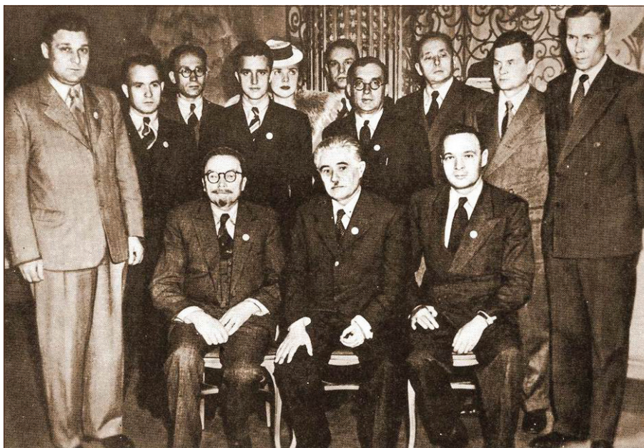
О. В. Палладін у складі делегації УРСР на Установчій конференції Організації Об'єднаних Націй у Сан-Франциско, 1945 р.

Країна напружувала всі сили, аби відродити промисловість, сільське господарство, підвести з руїн міста і села. І цілком природно, що погляди трудівників з надією були звернені до вчених. Вони чекали від них нових матеріалів і приладів, продуктивніших сортів сільгоспкультур, тобто конкретної, реальної допомоги. Дехто з учених розумів це як пряму вказівку відмовитися від фундаментальних досліджень, але О. В. Палладін, який сам немало зробив для практики, енергійно відстоював необхідність, перш за все, фундаментальних теоретичних досліджень. Він вважав, що справжній вчений ніколи не забуває про потреби виробництва, зі своїх теоретичних досліджень він завжди зробить практичні висновки. Тео-