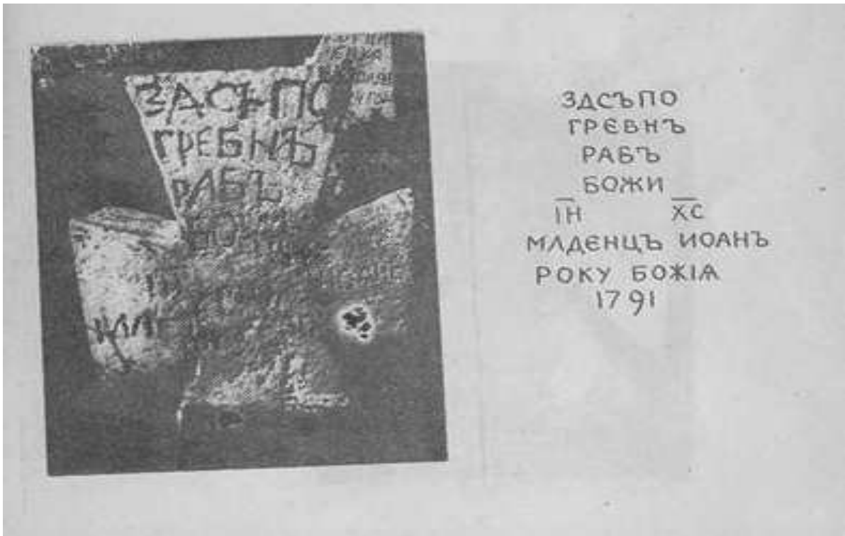
Ілюстрація 1. Фрагмент з книги Р. Шувалова: Шувалов Р. Про що розповів некрополь (Куяльницьке козацьке кладовище міста Одеси). – Київ, 1992. – С. 30.