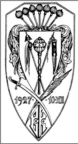
Рис. 6. Проект нагрудного знака Вільного козацтва (1927 р.)