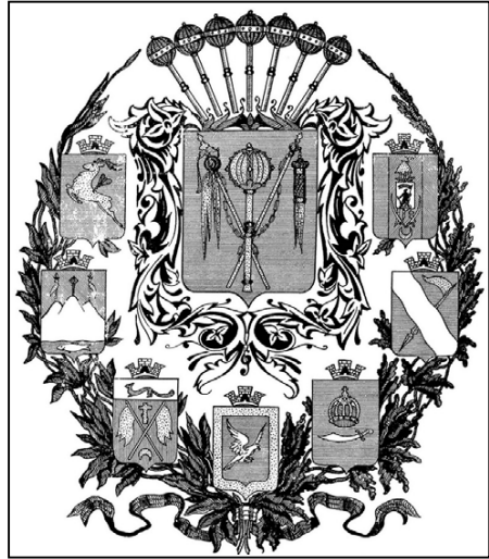
Рис. 7. Відкоригований проект великого державного герба Козації (1933 р.)