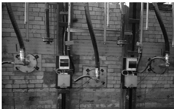
Рис.4. Расположение горелок ГНБ-80 и блоков управления ТК1301.03 на боковой стене печи.

ством Института газа НАН Украины. Огнеупорные защитные стаканы (туннели) ЗАО «Теплохиммонтаж» изготовил самостоятельно из муллитно-кремнеземистых огнеупорных материалов по чертежам, разработанным авторами. Основное назначение туннеля состоит в защите металлического носика горелки от облучения из рабочего пространства печи без изменения геометрических и аэродинамических характеристик факела.