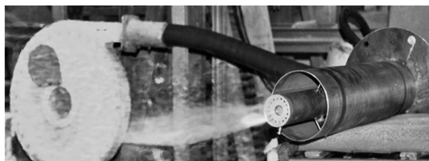
Рис.2. Скоростная горелка ГНБ-80 в установочной обойме.

ность температур по боковым сторонам садки составляла 5\text{--}20 \text{ }^\circ\text{C} , нижние ряды садки не обжигались. Кроме того, температура изделий на выходе из печи достигала 80\text{--}100 \text{ }^\circ\text{C} , что приводило к нерациональным потерям тепла и сказывалось на безопасности работы при разгрузке изделий.