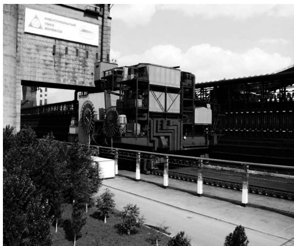
Рис.1. Коксовая батарея с технологией трамбования угольной шихты.

— широкое применение преобразователей частоты тока к электродвигателям нагнетателей