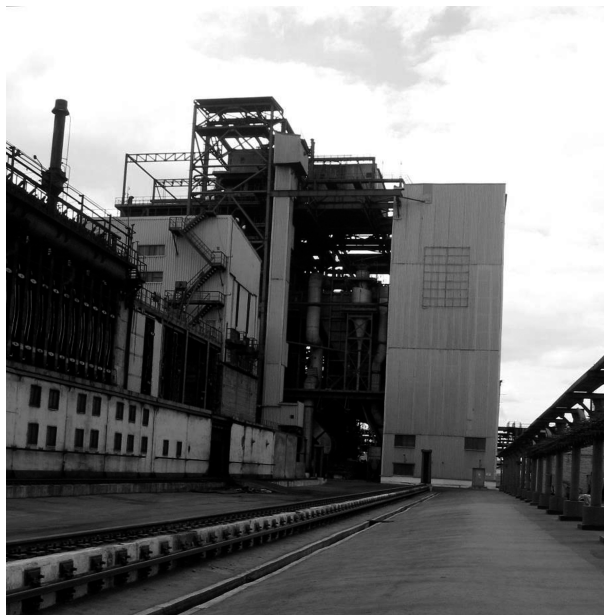
Рис.2. Установка сухого тушения кокса.

Процесс сухого тушения в камерах УСТК (рис.2) позволяет повысить качество кокса: улучшается гранулометрический состав кокса, повышается его механическая прочность, улуч-