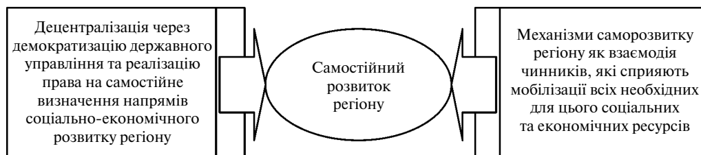
Рис. 3. Концептуальна схема взаємозв'язку децентралізації управління національною економікою через процеси саморозвитку регіонів

державного управління. Вона містить процеси децентралізації влади за умови реалізації права на самовизначення напрямів соціально-економічного розвитку регіону (території) з розробкою набору правових механізмів, а також забезпечує стійку рівновагу у суспільстві за рахунок досягнення компромісу між інтересами у тріаді "держава – регіон – населення" (рис. 3). Механізмом саморозвитку регіону є взаємодія чинників, які сприяють мобілізації всіх ресурсів для його здійснення. При цьому посилюються координуючі функції держави як регулятора процесів саморозвитку і зусиль для становлення сучасних інститутів самостійного розвитку, в тому числі вдосконалення чинного та розробка нового законодавства, яке б відповідало новій парадигмі регіонального розвитку.