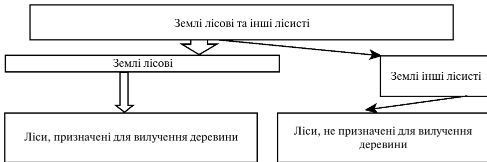
Рис. 2. Поділ земельних ресурсів за обліковими категоріями землекористування ЄЕК/ФАО ООН

його логічна сутність – вирощування лісу. За нормами ССКЗ, включенню до складу лісів підлягають лише деревні породи, здатні накопичувати деревину. Звідси і походять слова “лісокористування”, “лісоутворюючі породи”. До них жодним чином не належать “чагарники” (див. табл. і рис. 1), і тим більше – землі, “які вкриті заростями багаторічних дерев’янистих кущових рослин на сільськогосподарських угіддях, присадибних землях громадян”*. Наведені недоліки та суперечності у вітчизняному лісовому законодавстві перешкоджають розвитку української лісової справи.