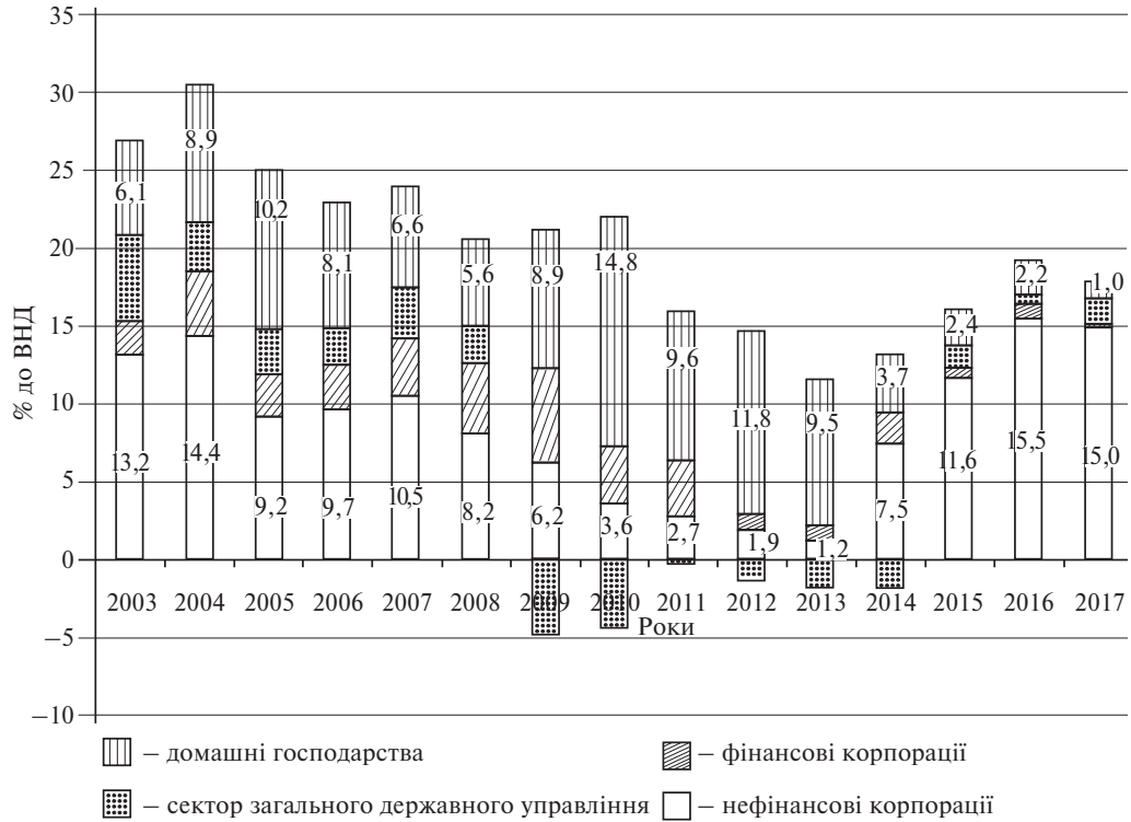
Рис. 1. Валове заощадження в розрізі інституційних секторів економіки

ані джерелом вагомих заощаджень, ані інвестором, і що лише згодом, коли підвищиться рівень доходів до певної межі та з'явиться прошарок більш заможних верств населення, сектор почне дедалі більше заощаджувати. Так воно і сталося. За 2003–2013 рр., незважаючи на кризове падіння у 2009 р., сектор підвищив рівень свого валового заощадження до 9,4% загального ВВП у середньорічному вимірі, що загальмувало обвальне падіння загального валового заощадження (рис. 1).