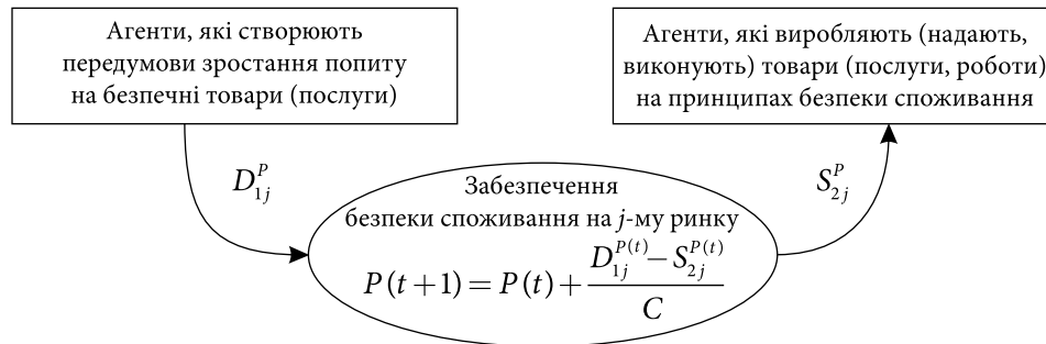
Рис. 2. Динаміка взаємодії учасників мультиагентської моделі забезпечення безпеки споживання: i — номер агента; j — ринок (сектор, сегмент) процесу безпеки споживання; P — ціна забезпечення безпеки споживання; D_{1j}^p — попит на безпечні (екологічні, «зелені») товари (послуги); t — часовий період споживання; S_{2j}^p — пропозиція безпечних товарів (послуг) на ринку (в секторі, сегменті); C — константа ітерації ринкового механізму досягнення рівноваги в системі безпеки споживання

З урахуванням викладеного, мультиагентська модель убезпечення споживання (рис. 3) відображає взаємодію агентів у межах інституціональних норм, зорієнтовану на гармонізацію інтересів держави, підприємництва та споживачів на основі ринкової ціни в рамках співвідношення попиту та пропозиції на безпечні товари (послуги, роботи). При цьому крім узгодження попиту і пропозиції передбачається досягнення бажаного рівня задоволення інтересів учасників процесу, тобто максимізація конвергенції інтересів учасників розглядається як передумова досягнення рівноважного стану системи. В основу моделі покладено: зростання попиту на безпечні товари (послуги, роботи), виробництво товарів безпечного споживання, підвищення громадської свідомості, виховання споживачів та виробників на принципах сталого споживання і забезпечення відповідності європейським стандартам.