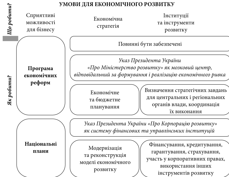
Рис. 1. Програмні заходи забезпечення економічного прориву в державній політиці на засадах смарт-управління

соціальна програма розвитку країни, що може об'єднати конкуруючі політичні сили, суспільні групи різних спрямування та інтересів. На жаль, низька якість державної політики і суспільних інститутів, що не забезпечують соціальної згуртованості та підвищення рівня розвитку соціального капіталу, є основними чинниками зниження конкурентоспроможності національної економіки в глобальному середовищі. Отже, для економічного прориву необхідними є три умови: економічна стратегія; сприятливі умови для бізнесу; інститути та інструменти розвитку (рис. 1). Такий підхід забезпечить реалізацію технології смарт-управління в державній політиці в умовах зростання глобальних викликів і динамічних змін.