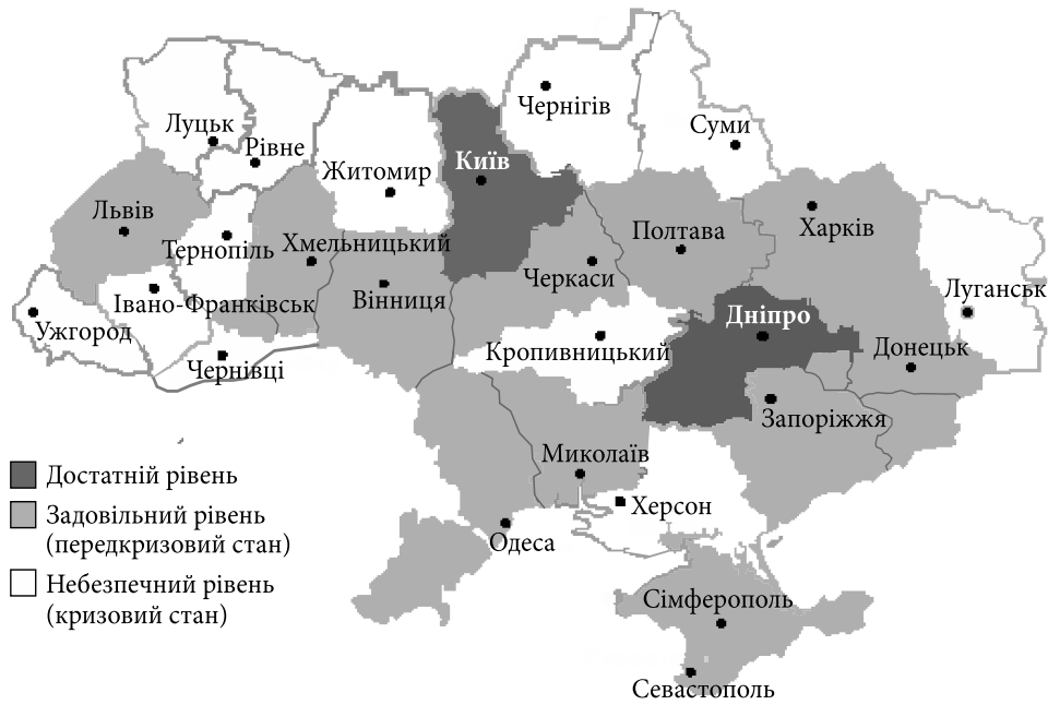
Рис. 2. Рівень економічної безпеки регіонів України у 2019 р.

5. Здатність здобувати конкурентну перевагу — навчання та ефективне функціонування регіональної інноваційної системи на основі розвитку науки й освіти в сучасних сферах науково-технічного прогресу.