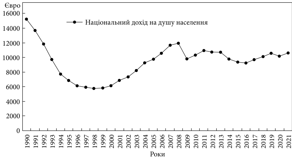
Рис. 1. Динаміка національного доходу в розрахунку на душу населення України за паритетом купівельної спроможності, євро

Війна в Україні поглибила довоєнні проблеми в економіці: у 2022 р. падіння ВВП склало, за попередніми оцінками, більш як 29,0 %; Україна також стикається з безпрецедентними гуманітарними викликами. З огляду на це, однозначно потрібен не ізольований соціально-економічний/фінансовий підхід до відновлення України, а одночасні процеси і в інших трьох вимірах соціальної якості , з метою визначення якості результатів економічної політики і політики в цілому.