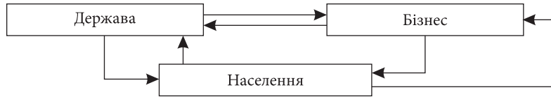
Рис. 1. Блок-схема 1 — модель взаємодії держави, бізнесу і населення в соціальній державі, яка забезпечує розвиток на засадах конкуренції і політики соціальної якості життя населення