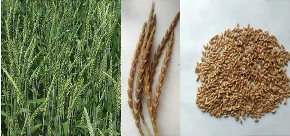
Рис. 1. Рослини, колос і зерно Triticum spelta L.

печують значне різноманіття пшениці за висотою рослин [42], та встановлено вплив на цю ознаку великої кількості генів-модифікаторів [43]. Спельта має багато небажаних генів, зокрема алелі Rht-B1a , Rht-D1a , які контролюють формування високих стебел [31]. Для зменшення висоти рослин T. spelta і створення її короткостеблових форм проводять цілеспрямовану гібридизацію спельти із низькорослими сортами м'якої озимої пшениці, що несуть домінуючі або рецесивні гени карликовості [31]. Внаслідок схрещування утворюється потомство з широким діапазоном мінливості за висотою рослин, що зумовлено різними типами взаємодії генів. Встановлено, що лінії, які були селекційно поліпшені, мали висоту рослин 123–130 см (див. табл. 1). Вони були вищими порівняно із сортом Наталка, в середньому на 23,4 см, проте нижчими (на 20,4 см) порівняно із сортом спельти Зоря України. Виділені лінії УК 3901С/22 і УК 3980С/23, які мали висоту 123 см і 124 см, відповідно, і вірогідно не відрізнялися від м'якої пшениці за цим показником.