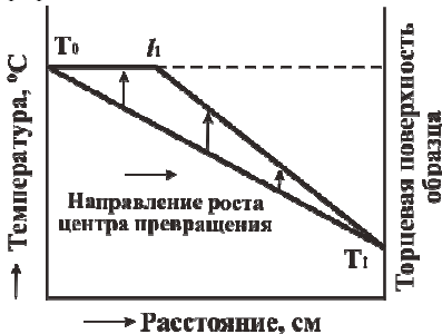
Рис.1. Изменение температуры по длине одномерного образца по мере продвижения фронта фазового превращения в сторону переохлажденной высокотемпературной фазы.

В силу постоянства температуры фронт превращения является барьером, который препятствует поступлению теплоты из уже сформировавшейся низкотемпературной фазой в находящуюся перед фронтом превращения высокотемпературную фазу. Поэтому температура и самого центра превращения в течение его роста остается постоянной и равной T_0 . Так что при достижении фронтом превращения, продвигающегося в сторону переохлажденной высокотемпературной фазы, положения, например, l_1 (рис.1), распределение температуры в пределах участка образца со сформировавшееся низкотемпературной фазой будет отражать линия T_0l_1 , а еще не испытавшей превращения высокотемпературной фазой – линия l_1T_1 .