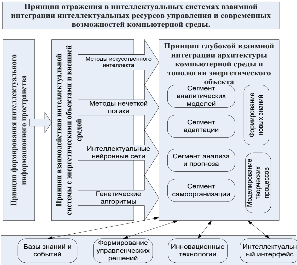
Рис.1. Організація відображення інноваційних моделей штучного інтелекту в інтелектуальних комп'ютерних мережах

Принцип взаємодії інтелектуальної системи з енергетичними об'єктами та зовнішнім середовищем є основою організації сукупності інтелектуальних інноваційних моделей підвищеної інтелектуальної складності та розмірності, наприклад, моделі штучного інтелекту, моделі нечіткої логіки, моделі інтелектуальних нейронних мереж, моделі генетичних алгоритмів та інших. У синтезованих моделях завдяки суттєво уточненому опису процесів функціонування енергосистеми відкривається можливість не лише отримання додаткових знань про досліджуваний об'єкт та зовнішній світ, а також і динаміку зміни їх стану в результаті реалізації активної поведінки інтелектуальної комп'ютерної мережі.