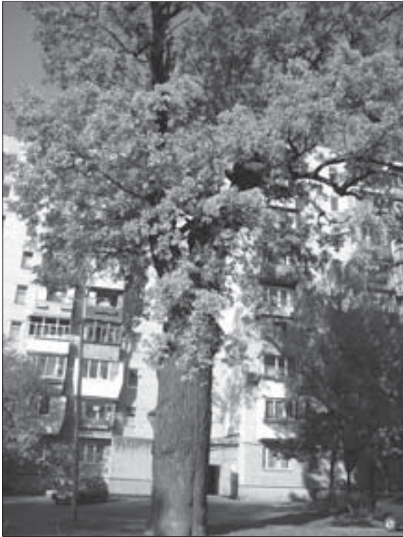
Віковий дуб Крістера на вул. Осиповського