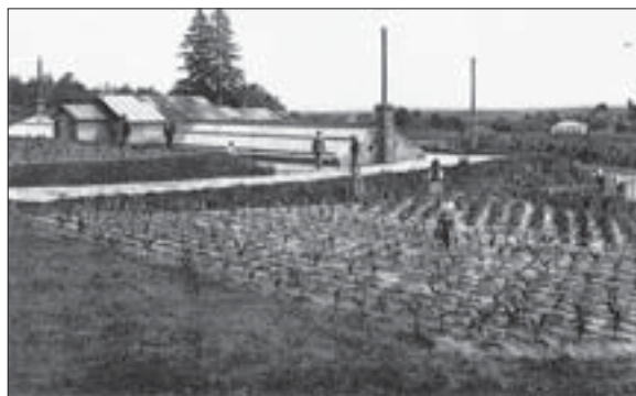
Розсадник та оранжерея

декоративних рослин "Троянда"). Нині ця територія віддана під забудову житла, розрахованого на 20 000 осіб. При цьому передбачено збереження пам'ятки природи місцевого значення "Крістєрова гірка", що займає площу 4,3 га і являє собою масив старих дерев та каскад з чотирьох ставків загальною площею 0,5 га, споруджених Крістерами в місцях виходу джерельних вод. Тут гніздяться крижні.