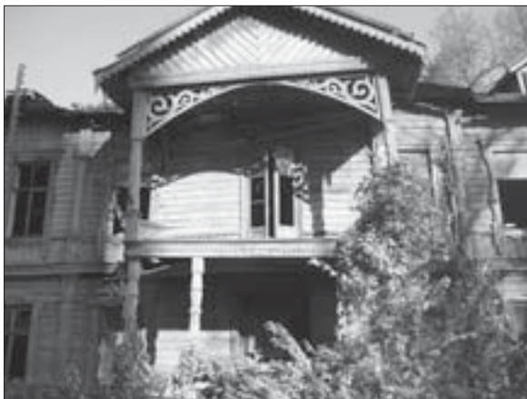
Контора садівництва (сучасний стан)

565 см. Це дерево є залишком величних куренівських лісів часів Вільгельма Крістера.