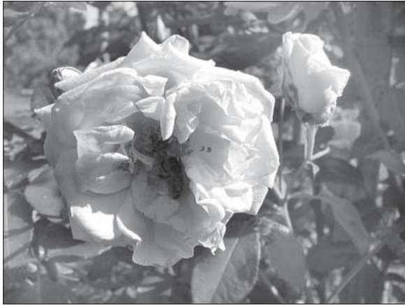
Рис. 1. Троянда 'Marechal Niel' з колекції Національного ботанічного саду ім. М.М. Гришка НАН України

калуфер, рута, фиалки лазоревые и желтые, пижма, иссоп» [15, с. 8–9].