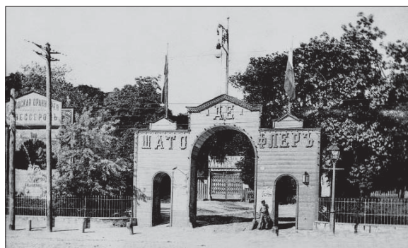
Рис. 3. Вхід до оранжерей О.К. Вессера (зліва)

У парку «Олександрія» в маєтку магнатів Браницьких (м. Біла Церква) існувала чудова оранжерея. «Ми отримали, — пише І. Фундуклей, — захоплені відгуки гостей Браницьких про Rosa chinensis Jacq., яка заплітала своїми гілками всю стіну оранжереї, на яких були тисячі квіток» [19, с. 492].