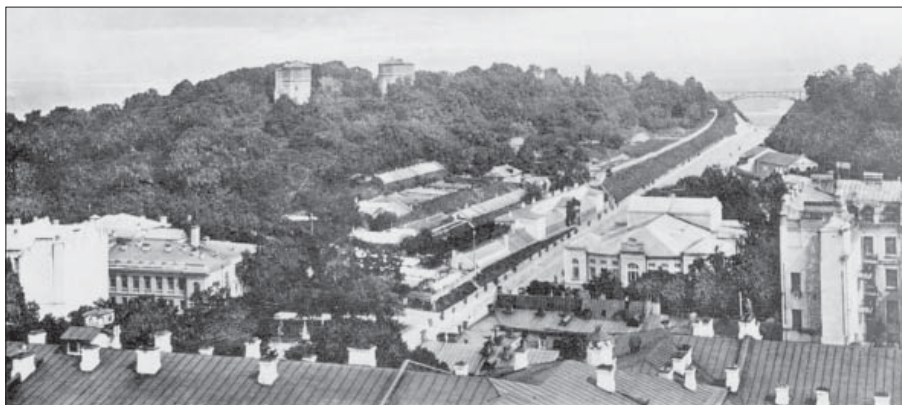
Рис. 4. Оранжереї О.К. Вессера на Царській площі

Є також відомості про оранжерею в с. Новоселиці (Старокостянтинівський р-н Хмельницької обл.). Парк був заснований у середині XVIII ст. «Довольно далеко от дома в конце еловой аллеи стояла оранжерея, наполненная цитрусовыми деревьями. Достопримечательностью была очень старая пальма. Вторым растением после пальмы, заслуживающим внимания, была роза 'Marschal Niel', толщиной в предплечье человека, достигающая крыши» [28] (рис. 1).