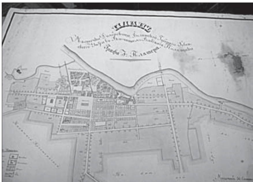
Рис. 3. План м. Дубровиця (1855 р.)