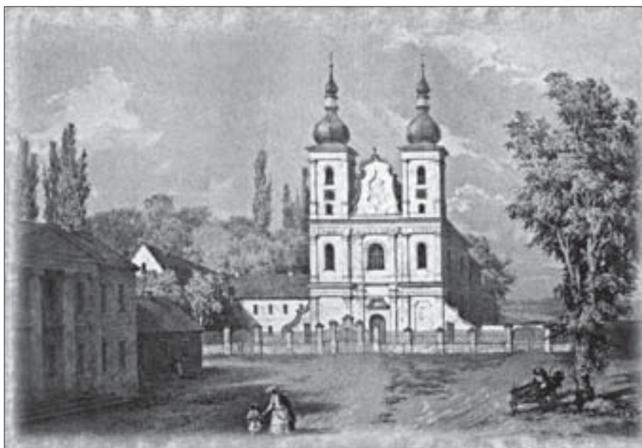
Рис. 2. Загальний вигляд Дубровицького монастиря (гравюра Наполеона Орди, 1855)

піарських шкіл були видатні особистості. Так, у школі піарів у м. Любешів (сучасна Волинська обл.) навчалися національний герой Польщі Тадеуш Костюшко та видатний ботанік, професор Віленського університету Станіслав Юндзілл [6].