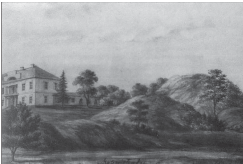
Рис. 1. Пейзажний парк у Мотовилівці на Київщині. Рисунок Наполеона Орди Figure 1. Landscape garden in Motovylivka in Kyiv region. Illustration of Napoleon Orda