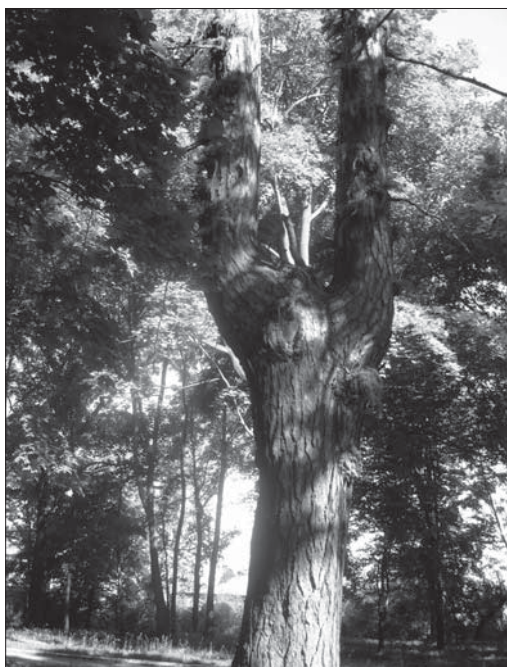
Рис. 2. Пейзажний парк у Мотовилівці. Сучасний вигляд