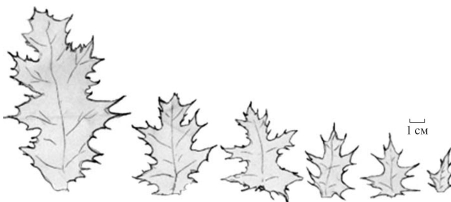
Рис. 4. Форма листків генеративної сфери Argemone mexicana

black – the primary shoot; dark gray – secondary shoot; light gray – tertiary shoot; white – quaternary shoots