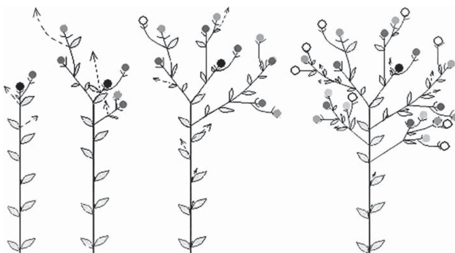
Рис. 3. Схема формування пагонової системи у Argemone mexicana :

чорним кольором позначено основний пагін, темно-сірим кольором – пагони II порядку, світло-сірим – пагони III порядку, білим – пагони IV порядку