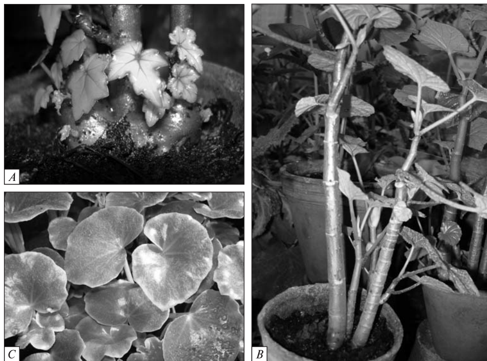
Рис. 1. Загальний вигляд видів роду Begonia : А — B. dregei ; В — B. dichotoma ; С — B. venosa