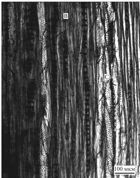
Рис. 2. Повздовжній зріз вторинної ксилеми Calycanthus floridus : В — волокна; С — судини

Серцевина. У центрі стебла розташована тонкостінна паренхімна тканина з неоднорідних клітин, які відрізняються за розміром і характером вмісту. Більш великі не мають живого вмісту, стінки їх дерев'яніють. Навколо розташовуються ще живі клітини, але зазвичай з темним вмістом, багатим на дубильні речовини. Ближче до деревини розташовані дрібніші клітини серцевини, зазвичай багаті на крох-