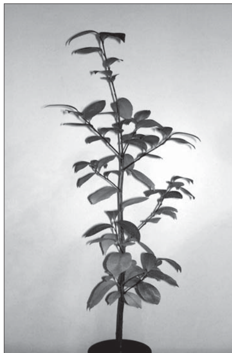
Рис. 1. Загальний вигляд Camellia oleifera Abel Fig. 1. General view of Camellia oleifera Abel

Бруньки сидячі, поодинокі. Верхівкові бруньки зазвичай листкові, а пазушні — змішані. Розташування пазушних бруньок чергове, розставлене, іноді — розсіяне (можуть чергуватися довгі та короткі міжвузля). Форма пазушних бруньок — конусоподібна, а верхівкових — як конусоподібна, так і веретеноподібна. За розміром бруньки дрібні, верхівкові — 0,15—0,45 см завширшки та 0,3—1,1 см завдовжки, а пазушні — 0,1—0,3 см завширшки та 0,1—0,7 см завдовжки. Верхівка бруньки зазвичай загострена, іноді — притуплена. Пазушні бруньки на верхівці притуплені. Бруньки