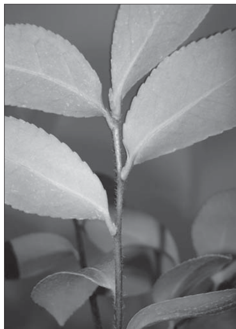
Рис. 2. Молодий пагін Camellia oleifera Abel Fig. 2. Young shoot of Camellia oleifera Abel