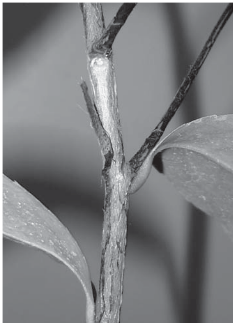
Рис. 3. Відшарування первинної кірки на дворічному пагоні Camellia oleifera Abel