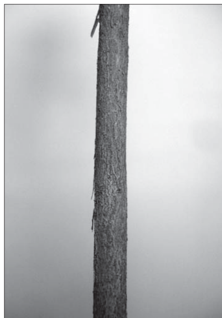
Рис. 4. Багаторічний стовбур Camellia oleifera Abel