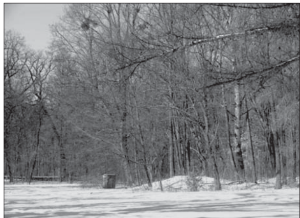
Рис. 2. Територія ділянки до початку реставраційних робіт