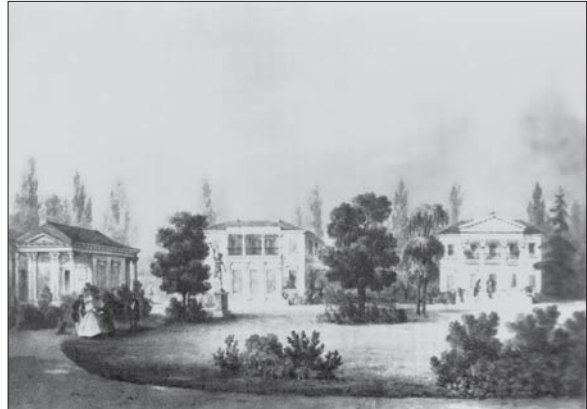
Рис. 1. Вид на павільйони (зліва — Танцювальний павільйон). Сепія Юзефа Ріхтера, 1837 р.

У верхній частині парку була розташована літня резиденція — «Аустерія», яка є елементом регулярного стилю (піднесення будинку над парком) [30]. «Танцювальний павільйон» був розташований на південь від палацу. Це був одноповерховий будинок у класичному стилі