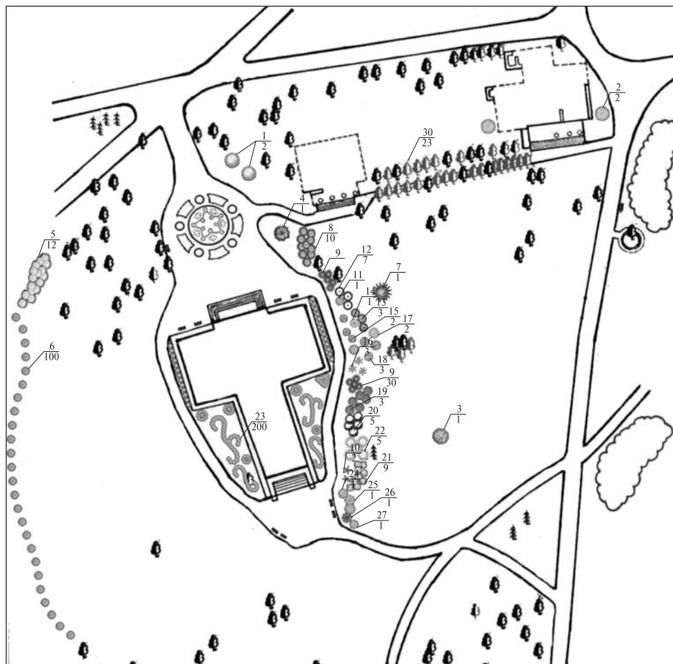
Рис. 5. План-схема оптимізації насаджень ділянки «Танцювальний павільйон»: 1 — Robinia pseudoacacia ‘Globosa’; 2 — Robinia pseudoacacia ; 3 — Liriodendron tulipifera L.; 4 — Acer platanoides ‘Royal Red’; 5 — Ligustrum vulgare L.; 6 — Philadelphus coronarius L.; 7 — Larix leptolepis (Sieb. et Zucc.) Gord.; 8 — Juniperus chinensis L. ‘Pfitzeriana’; 9 — Mahonia aquifolium (Pursh) Nutt.; 10 — Cotoneaster horizontalis Decne.; 11 — Cotoneaster dammeri Schneid.; 12 — Rhodothyus kerrioides Sieb. et Zucc.; 13 — Cornus alba L.; 14 — Cornus stolonifera (Michx.) Rudb. ‘Flaviramea’; 15 — Pentaphylloides fruticosa (L.) O. Schwarz ‘Albottswood’; 16 — Pentaphylloides fruticosa ‘Goldteppich’; 17 — Kerria japonica DC.; 18 — Rosa multiflora Thunb.; 19 — Rosa rugosa Sieb.; 20 — Spiraea × cinerea Zabel. ‘Grefsheim’; 21 — Spiraea × bumalda Burvenich ‘Goldflame’; 22 — Forsythia suspensa L.; 23 — Pyracantha coccinea (L.) V. Roem.; 24 — Syringa vulgaris ‘Mrs. Edwing Harding’; 25 — Syringa vulgaris L. ‘Monblan’; 26 — Syringa vulgaris ‘Taras Bulba’; 27 — Syringa × chinensis Willd.; 28 — Chaenomeles maulei (Mast.) C.K. Schneid.; 29 — Forsythia viridissima Lindl. ‘Weber’s Bronx’; 30 — Carpinus betulus . У знаменнику наведено кількість екземплярів