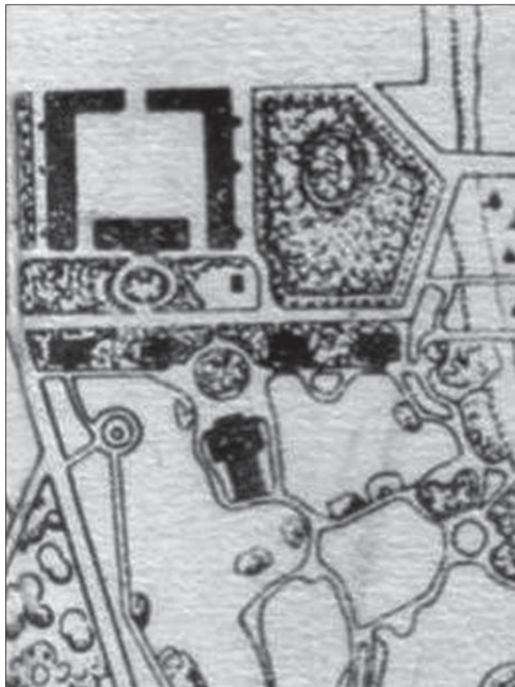
Рис. 3. Фрагмент карти парку «Олександрія», 1858 р. Fig. 3. Detail of map of the park “Olexandria”, 1858

Територію навколо «Танцювального павільйону» було прикрашено скульптурами, деревними екзотами і квітами.