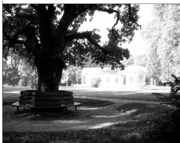
Рис. 4. Сепія Вілібальда Ріхтера (1828) (вгорі) та відновлена історична композиція (2015) (внизу)