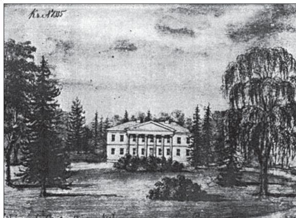
Рис. 2. Палацово-парковий ансамбль у маєтку князя М. Радзивілла в с. Підлужне. З акварелі Наполеона Орди (1872)

До переліку оранжерейних рослин потрапили види, які на Волинському Поліссі можуть зростати у відкритому ґрунті, зокрема Achillea ptarmica та Gypsophila paniculata , природні ареали яких охоплюють Волинське Полісся, і Veronica multifida , котра є видом природної флори України. Вони фігурують лише