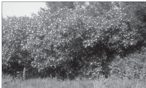
Рис. 3. Зарості Ptelea trifoliata та Sorbaria sorbifolia — все, що залишилося від міклерівського парку в с. Підлужне