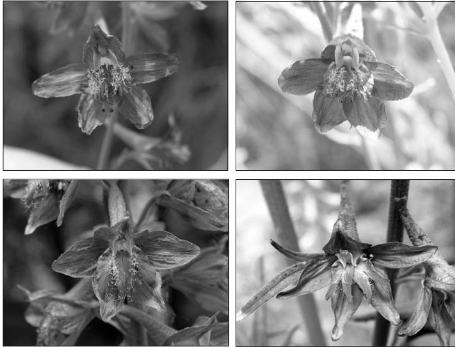
Рис. 2. Різноманіття квіток особин Delphinium sergii (м. Київ, Національний ботанічний сад імені М.М. Гришка НАН України)