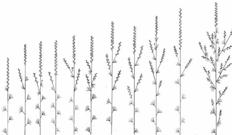
Рис. 1. Типи галуження генеративного пагона Delphinium sergii у дворічних особин