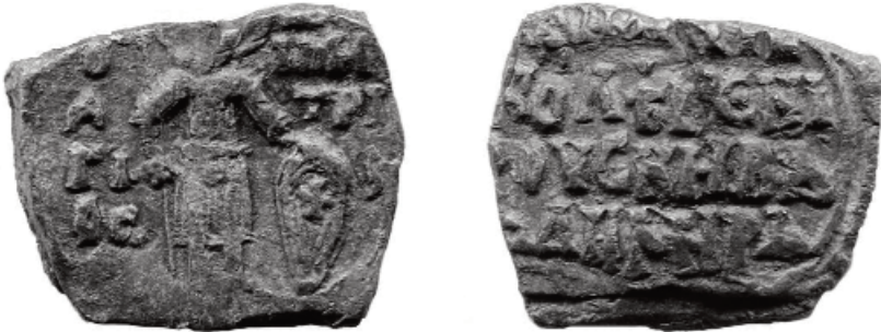
Фото 2. Печатка боярина Дмитра

2. Прямокутна за формою свинцева печатка. Канал для шнура розташовано вертикально. Заготовка пластинчата (фото 2.).