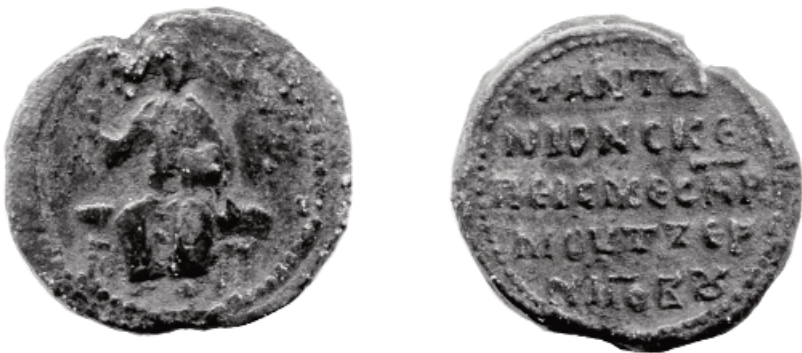
Фото 3. Печатка чернігівського єпископа Антонія

3. Кругла свинцева печатка. Канал для шнура розташовано вертикально з незначним зміщенням по діагоналі. Заготовка одинарна, лита (фото 3.).