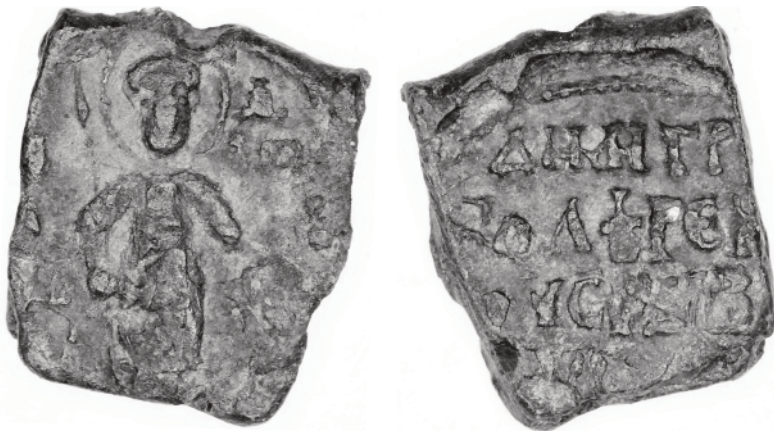
Фото 1. Печатка боярина Дмитра

1. Прямокутна за формою свинцева печатка. Канал для шнура розташовано вертикально. Заготовка пластинчата (фото 1.).