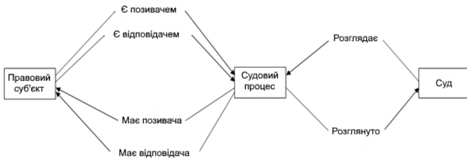
Рис. 3. Фрагмент діаграми спеціальних бінарних відношень правового суб'єкта онтології

2) Таблиця бінарних відношень для кожного відношення, вихідний концепт якого входить до класифікаційного дерева. Уривок зі слота бінарних відношень подано в таблиці 5. Для кожного відношення фіксують його ім'я, імена концепту-джерела та цільового концепту, інверсне відношення тощо. Приклад фрагмента діаграми спеціальних бінарних відношень наведено на рисунку 3.