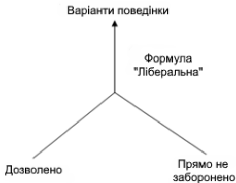
Рис. 4. Фрагмент дерева класифікування атрибутів за формулою