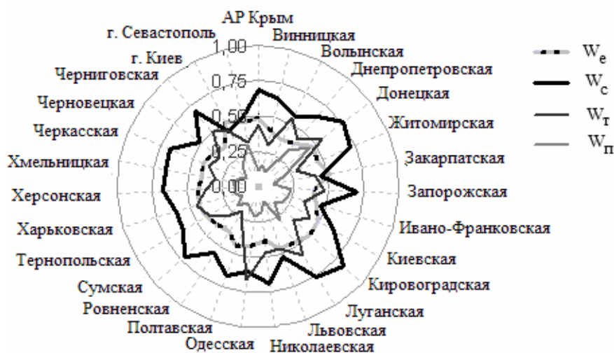
РИС. 1. Ранжирование регионов Украины по уровням природных ( W_n ), техногенных ( W_m ), социальных ( W_c ) и экономических ( W_e ) угроз в системе ЖКХ

Ранжирование регионов Украины по уровням социально-экономических и природно-техногенных угроз системе ЖКХ. С помощью разработанного программного обеспечения на основании данных [5, 6], а также данных, предоставленных министерством ЖКХ, проведено ранжирование регионов Украины по уровням социально-экономических и природно-техногенных угроз системе ЖКХ. Согласно полученным результатам, представленным на рис. 1, по индексу природных угроз наиболее неблагоприятная ситуация в Донецкой, Днепропетровской, Луганской областях и в г. Севастополе. Наименее угрожающая ситуация в Черновицкой, Львовской, Закарпатской областях и АР Крым.