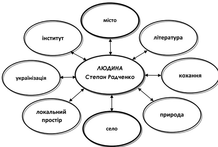
Рис. 2. Когнітивно-польова структура концепту «людина»

У творі В. Підмогильного Степан Радченко персоніфікує та символізує узагальнений образ людини майбутнього, свого часу запрограмований радянською владою. Саме через призму світосприйняття сільського хлопця спроектовано та різноаспектно вербалізовано ключовий мислеобраз «місто». Тому виокремлення концепту «людина» в лінгвокогнітивному просторі художньо-персонажного дискурсу є не менш важливим. Його структура (рис. 2) засвідчує дещо щільнішу конфігурацію складників, ніж у будові концепту «місто» (пор.: рис. 1), а це означає, що дискурсивна зона персонажа є найвпливовішою у формуванні аналізованого мислеобразу.