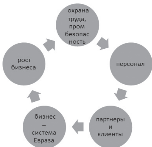
Рис. 1. Ключевые стратегии ПАО «ЕВРАЗ – ДМЗ им. Петровского»

Для каждого предприятия характерен набор технологий материального или интеллектуального производства, который используется в работе. Качество этих технологий и их соответствие новейшим мировым стандартам кардинальным образом влияют на эффективность деятельности организации, а следовательно и на обеспечение экономической безопасности.