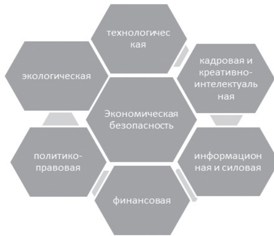
Рис. 2. Схема элементов экономической безопасности