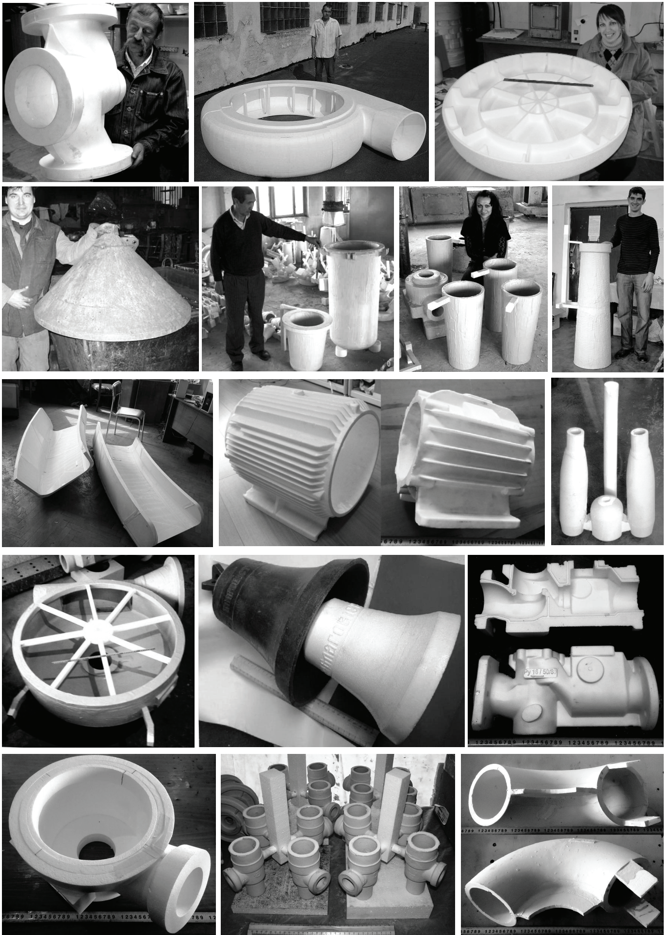
Рис. 1. Примеры моделей отливок оболочковых конструкций