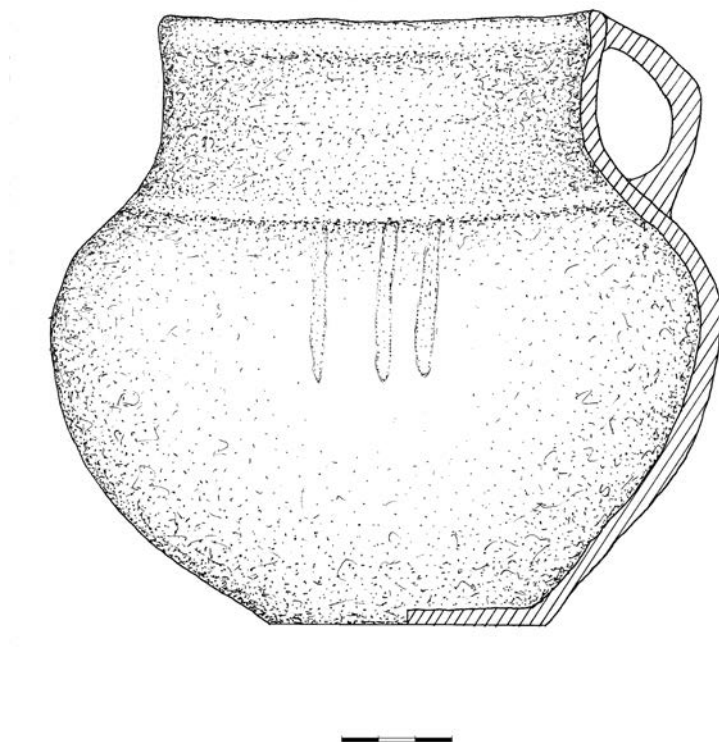
Рис. 2. Белз. Кераміка Fig. 2. Belz. Ceramics

[Пелецишин, 1998, с. 163] та стжижовської – Валентинів [Пелецишин, 1966, с. 81–82; 1971, с. 97–98], Коршів [Свєшніков, 1974, с. 128].