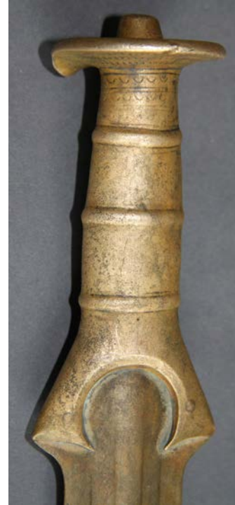
Фото 19. Руків'я меча із Черепківців Photo 19. Handle of sword from Cherepkivtsi