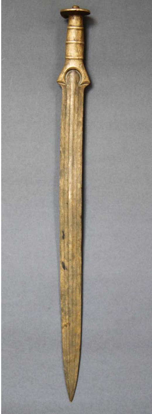
Фото 18.* Бронзовий меч із с. Черепківці Глибоцького р-ну Чернівецької обл. Photo 18. Bronze sword from Cherepkivtsi, Hlyboka district, Chernivtsi region