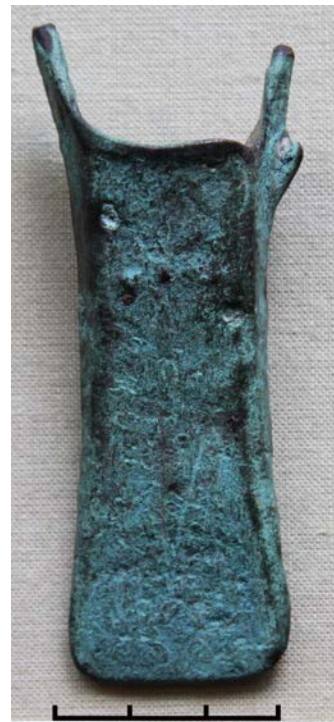
Фото 20. Бронзовий кельт із с. Кальна Долинського р-ну Івано-Франківської обл. Photo 20. Bronze celt from Kal'na, Dolyna district, Ivano-Frankivsk region