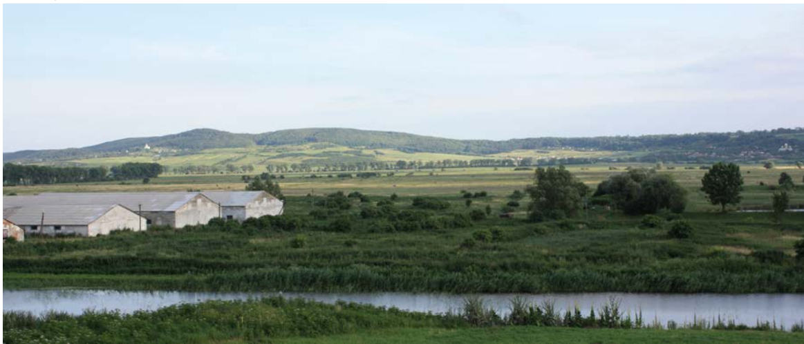
Рис. 1. Краєвид Давидівського плато із сторони Звенигорода. Вид з півдня Fig. 1. Davydov plateau landscape from the side of Zvenyhorod. View from the south

Ріки, які протікають в околицях Звенигорода, належать до басейну Західного Бугу. На сьогодні це невеличкі річечки та потічки, перетворені здебільшого на меліоративні канали. За своїм режимом вони відносяться до рівнинного типу. Основною річковою артерією у Звенигороді є річка Білка, права притока р.Полтви. У Білку впадають Водниківський, Коцурівський та Романівський потоки і р. Горожанка (ліві притоки). Долина річки Білки в льодовиковий період була сильно розмита талими льодовиковими водами. У поперечному перерізі вона має трапецієподібну (ближчу до коритоподібної) форму, плоске днище, пологі схили і дуже розмиті тераси. Заплава сягає в ширину до 2 км. Східніше від Звенигорода через Городиславичі протікає р. Кишице (права притока Білки), в долині між Під’ярковом і Станимиром численні струмки зливаються у русло Тимковецького потоку (правого притоку Полтви).