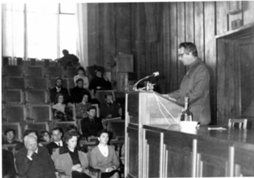
Рис. 6. Дмитро Якович Телегін (1919–2011) Fig. 6. Dmytro Telegin (1919–2011)

мотивів – піктограм, а також виписки з іноземної літератури з лінгвістики та ідеології [НА ІА НАНУ, ф. 26, спр. 193]. Ймовірно, ці матеріали були підготовчими до статті “ Черты религиозных представлений яфетического Средиземноморья ” [НА ІА НАНУ, ф. 26, спр. 319; спр. 320–330]. Також у особовому архіві археолога виявлені неопубліковані роботи “ Спроба стратиграфічного вивчення київської ономастики ” [НА ІА НАНУ, ф. 26, спр. 149] та чернетка статті “ Древнерусская надпись из Румынии времен походов Игоря на Византию ” [НА ІА НАНУ, ф. 26, спр. 150], разом з якою зберігається відбиток напису на папері.