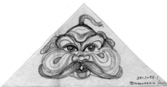
Рис. 2. Рисунок Валентина Даниленка. 24 січня 1948 р. Fig. 2. Valentyn Danylenko's drawing. 24 of January, 1948