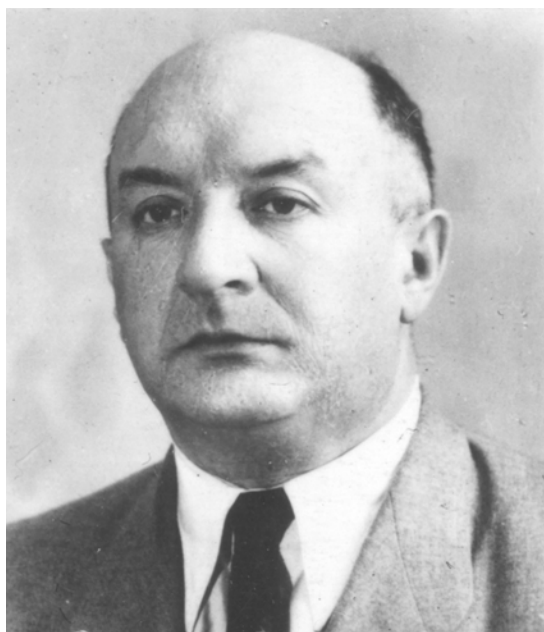
Рис. 2. Славін Лазар Мусійович (1906–1971) Fig. 2. Slavin Lazar Musiyovych (1906–1971)

Постать Л. Славіна (1906–1971) давно заслуговує на окреме монографічне дослідження (рис. 2). Попри плідні наукові розробки вченого-антикознавця, він також зробив вагомий внесок у розвиток організації фахової освіти в галузі археології та музейної справи. Тут Л. Славіна можна вважати справжнім новатором: заснована ним в університеті 1944 р. кафедра археології – перший і єдиний на той час спеціалізований центр по підготовці кадрів археологів в Україні. Враховуючи нагальні потреби, він проявляє ініціативу і добивається у 1952 р. значного розширення музеєзнавчої частини навчального плану: додається три музейні спецкурси (замість одного – “Музеєзнавство і краєзнавство” ) і дві музейні практики. Також, за його наполяганням, на другому курсі вводиться загальний курс для всіх істориків “Основи музейної справи” [Славін, 1952, с. 95]. Отже, у 1953 р. кафедра починає ще й спеціалізовану підготовку музейних працівників і стає кафедрою археології та музеєзнавства. Тоді це була перша в СРСР і одна з пер-