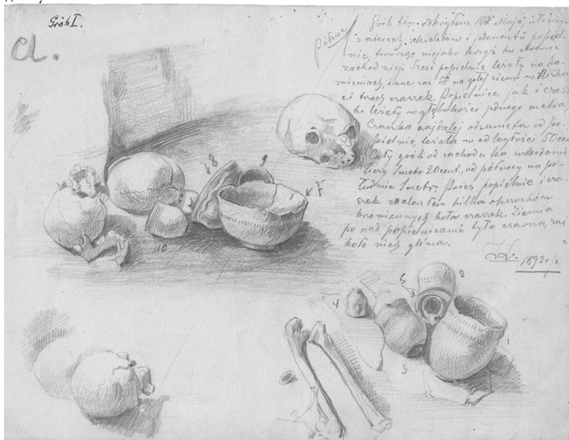
Рис. 1. Злата, урочище "Nad Wawrem", поховання I. Розкопки і рисунок З. Ленартовича. 1892 р. Fig. 1. Złota "Nad Wawrem" Place, burial I. Excavations and drawing by Z. Lenartowicz. 1892

Всі кістяки, зображені на аркушах, добре збережені, скорчені, розташовані на правому або лівому боці, спрямовані головою на захід або південний захід, лежать на ґрунті або на майданчику, викладеному з кам'яних плиток. В деяких випадках у похованні зафіксовано лише черепи та окремі довгі кістки скелета (зруйновані або порушені поховання?). Глиняний посуд знаходився в ногах похованих або ж поруч голови і піднесених до голови легко зігнутих рук. Посуду в похованнях, як правило, багато – від однієї до 13 штук. Форми посуду різноманітні – тут бачимо опуклобокі з короткими вінцями амфори з маленькими ручками та заглибленим орнаментом на плічках, s-подібної форми горщики з маленькими вушками або наліпним хвилястим валиком під вінцями, глибокі миски з розхиленими вінцями, орнаментовані різьбленими хвилястими лініями, кубки та дзбанки, прикрашені відбитками шнура. Кераміка згрупована в різні комбінації, часто один посуд знаходиться всередині іншого або стоїть один на одному.