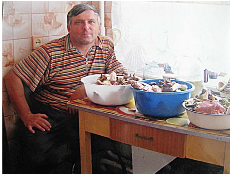
Рис. 3. Вдалий похід до лісу Fig. 3. Successful visit of forest

та ягоди, манили своєю врожайністю. Тому щоосені він із приємністю віддавався найдавнішій формі господарської діяльності людини – збиральництву. Не доводиться сумніватися, що ці “походи на природу” породжували в дослідника безліч різних думок, пов’язаних з адаптацією давньої людини до палеоландшафту. Це був гарний і слушний час для індивідуальних спостережень та обдумування різних реконструкцій давнього побуту. Тому не дивно, що інформація про доісторичне збиральництво, представлена у викладі В. Войнаровського цікаво і динамічно у хронологічному зрізі, відображає тисячолітні традиції в домогосподарстві. Закінчувалися такі походи до лісу об’ємним “уловом” грибів, які він із приємністю міг невтомно чистити годинами (рис. 3).