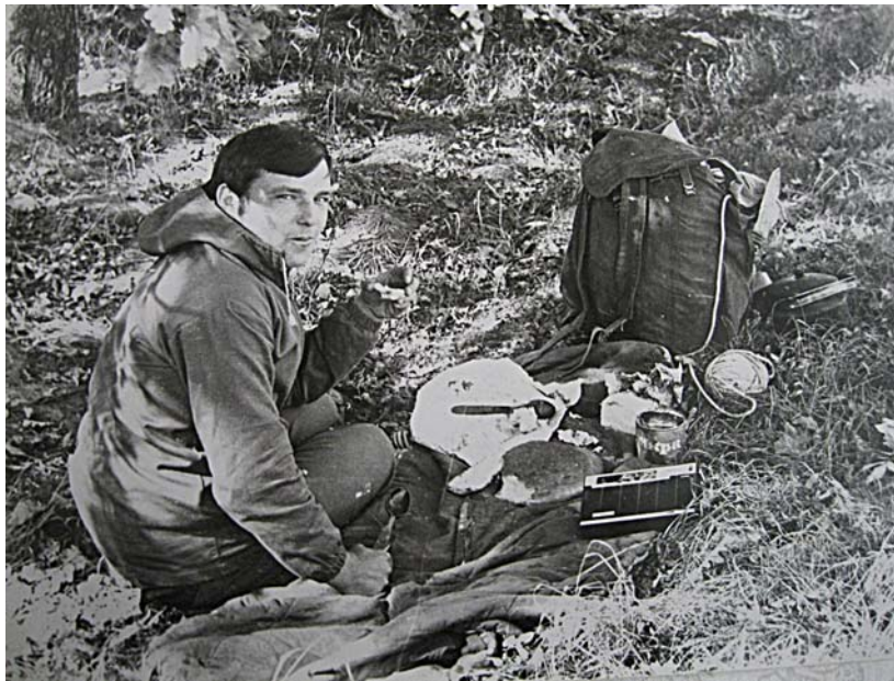
Рис. 5. Короткий відпочинок під час археологічної розвідки

Тоді ж організовував власні експедиції (рис. 5–6). Обстежував численні пам'ятки пізньоримського та ранньосередньовічного періодів; здійснив розкопки давньоруського могильника в Борівцях, де виявив підплитові поховання княжої доби, поселення IV–IX ст. Чорнівка I (1983–1984) та багаторічні розкопки (1985–1991) виробничого осередку черняхівської культури IV ст. н. е. в Добринівці I на Буковині (рис. 7). На основі здобутих у Добринівцях I матеріалів у 2013 р. вийшло монографічне опрацювання “Добринівці I чинбарський комплекс черняхівської культури на Буковині”, у якому В. Войнаровський представив палеоекономічний аналіз комплексу та передумови формування ще мало дослідженої виробничої діяльності носіїв черняхівської культури – спеціалізованого чинбарського виробництва як важливої складової варварського експорту пізньоримської доби.