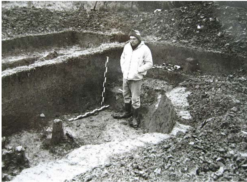
Рис. 7. Добринівці I. Розкопки чинбарського комплексу IV ст. н. е. Fig. 7. Dobrynivtsi I. Excavations of leatherworking workshop complex from IV century AD