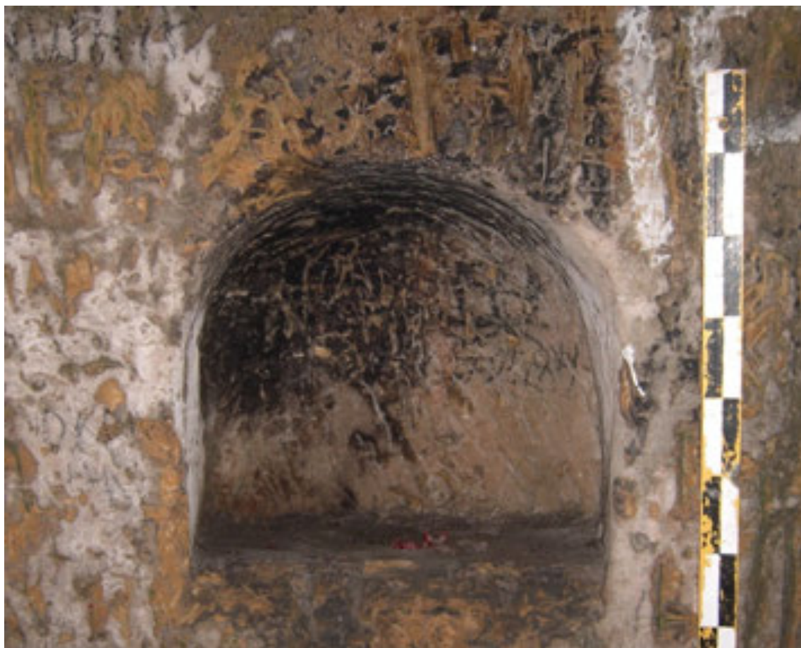
Рис. 3. Культова ніша