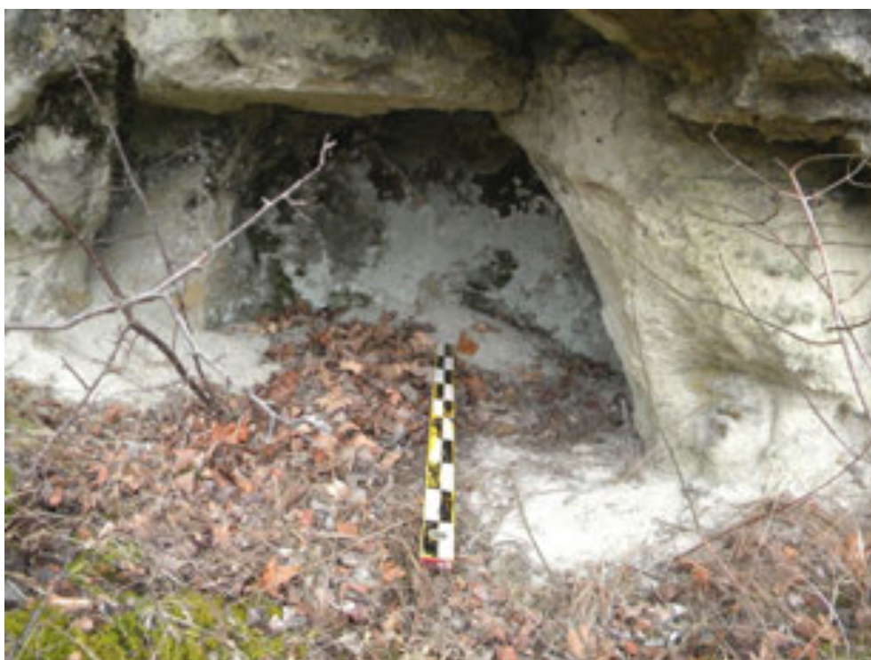
Рис. 5. Напівзруйнована печерна пам'ятка біля Миколаєва Fig. 5. Partially destroyed cave site near Mykolaiv