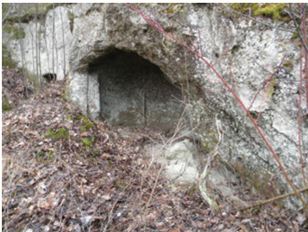
Рис. 6. Напівзруйнована печерна пам'ятка біля Миколаєва Fig. 6. Partially destroyed cave site near Mykolaiv