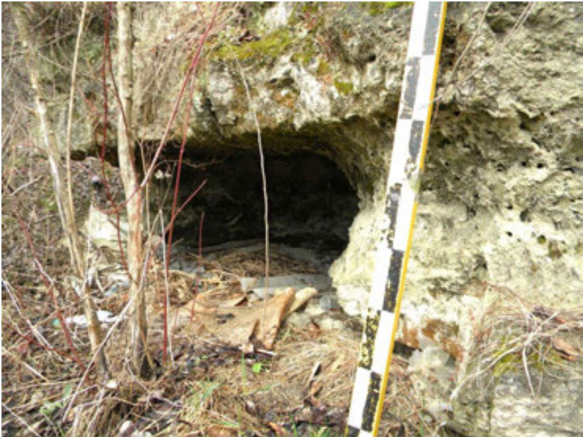
Рис. 7 Напівзруйнована печерна пам'ятка біля Миколаєва Fig. 7. Partially destroyed cave site near Mykolaiv

Вказана пам'ятка могла б успішно слугувати потребам розвитку краєзнавства, туризму, виховання на рівні об'єднаної територіальної громади (ОТГ), району чи області. Проте тривалий період вона залишаються маловідомою спорудою навіть для місцевих мешканців.