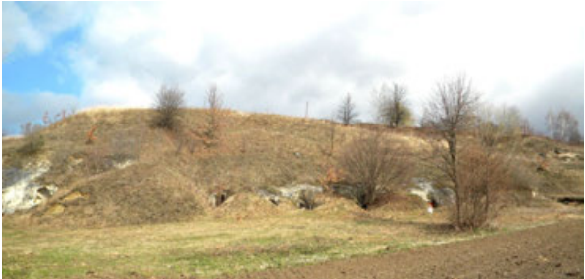
Рис. 1. Печерні камери біля с. Луб'яна Миколаївського р-ну Львівської обл.