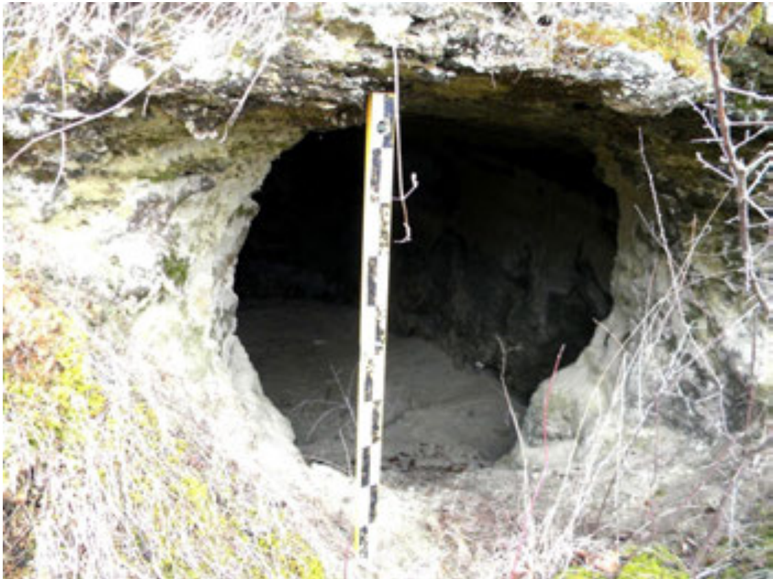
Рис. 2. Вхід у печерну камеру Fig. 2. Entrance to a cave chamber

Печерні камери мали різні розміри. Крім одноосібних печерних споруд, трапляються порожнини більших розмірів. Іноді вони могли помістити кілька людей. Такі великі камери з культовими нішами є поблизу печерних монастирів у Страдчі й Розгірчі [Берест, 2011, с. 125]. Про кількість мешканців печерної камери може свідчити число культових ніш. Адже кожен інок мав свого святого покровителя, іконка якого стояла в ніші, і він присвячував йому щоденну молитву. Якщо в печерній камері є дві й більше культових ніш, то це могло бути печерне житло ченців-келіотів. Вони порушували статутні правила і проживали в одній камері по кілька осіб, що заборонялося статутному чернецтву.