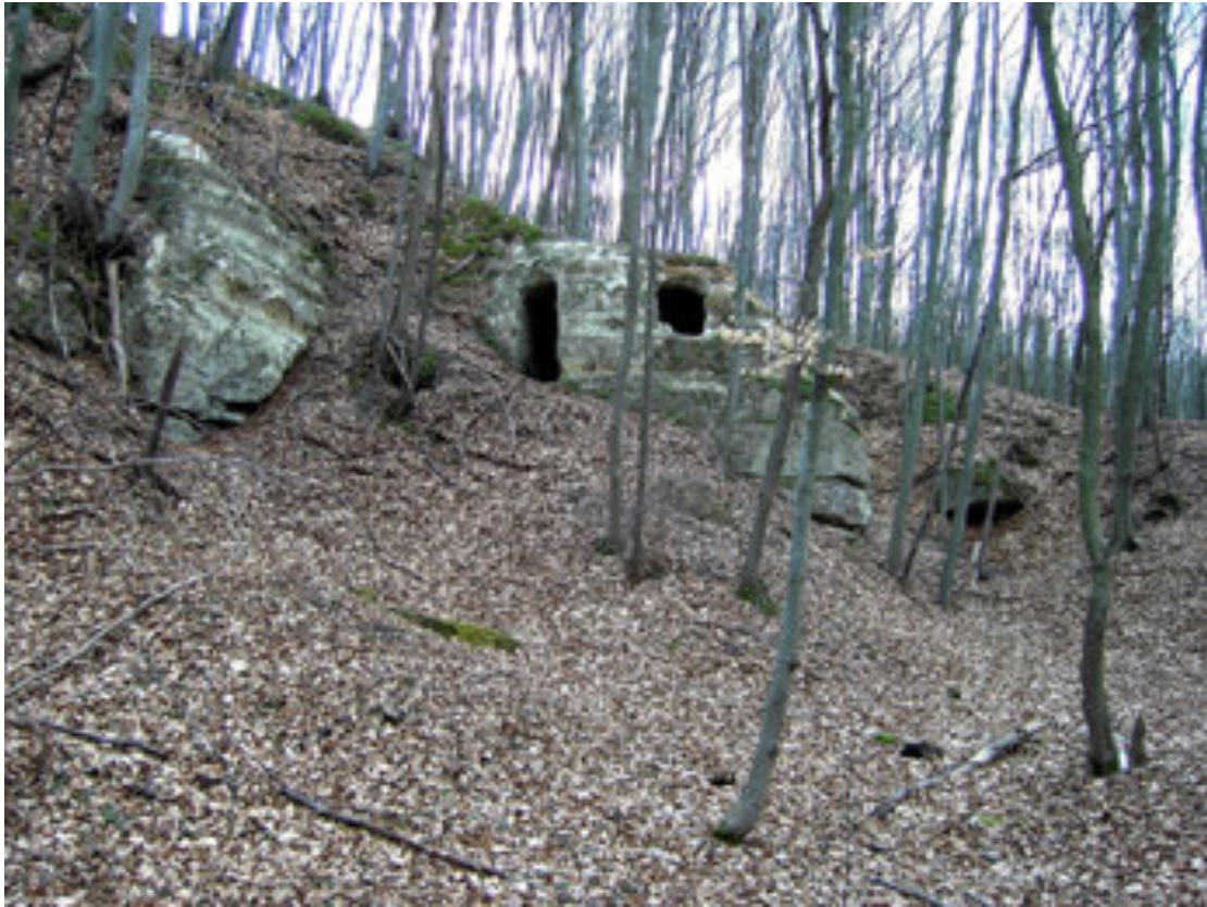
Рис. 4. Печерна пам'ятка біля с. Руда Рогатинського р-ну Івано-Франківської обл.