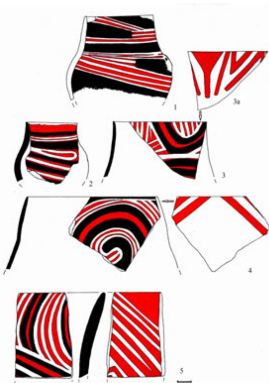
Рис. 1. Кераміка трипільського поселення Шипинці А (фонди Львівського історичного музею)

Матеріал з поселення походить із кількох різночасових верств – Трипілля VI (Шипинці А), VII та CI. Кількісно значно переважають речі пізніших етапів. Вони добре відомі в літературі, а сама пам'ятка Шипинці стала епонімною для шипинецької групи.