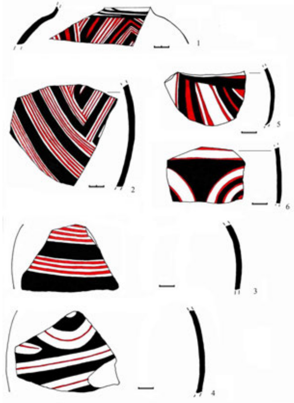
Рис. 3. Кераміка трипільського поселення Шипинці А (фонди Львівського історичного музею)

Глибокі миски з широкими дещо опуклими вінцями не зникли в подальшому – така форма побутувала на трипільських поселеннях етапу VI–VII (Заліщики, Бучач).