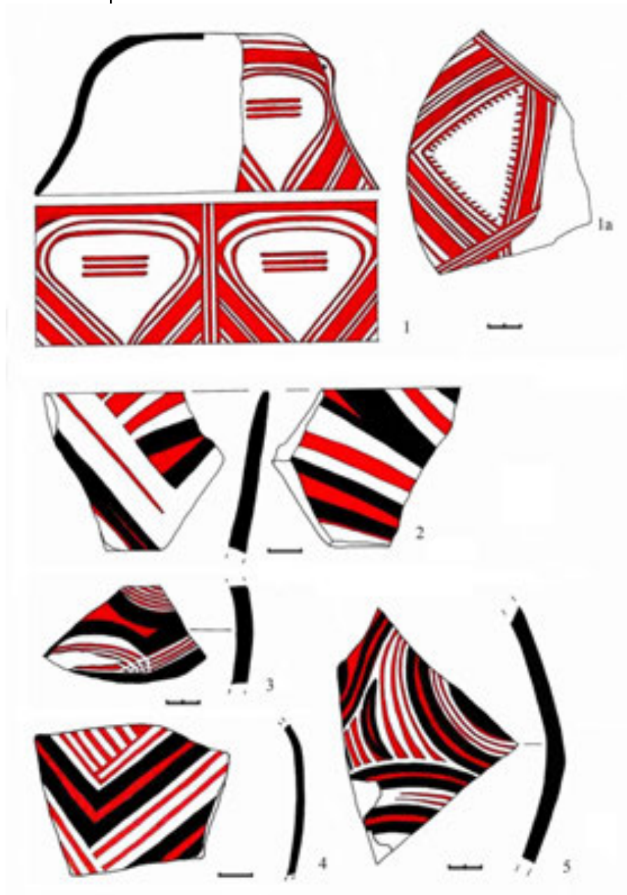
Рис. 2. Кераміка трипільського поселення Шипинці А (фонди Львівського історичного музею) Fig. 2. Ceramic ware from settlement of Trypillia culture Shypyntsi A (collections of the Lviv Historical Museum)

У збірці присутній винятково «столовий» посуд, як правило, мальований. У фондах ЛІМу відсутні зразки із заглибленим орнаментом, але про його наявність у керамічному комплексі Шипинців А писав О. Кандиба: «... фрагмент з білою фарбою, який був орнаментований рядами ямок і заглибленими лініями» [Кандиба, 2007а, с. 126]. Мальований посуд має такі форми: кубки, покришки, миски, грушоподібні посудини, чаші на піддоні, біноклеподібні посудини, ложки або черпаки.