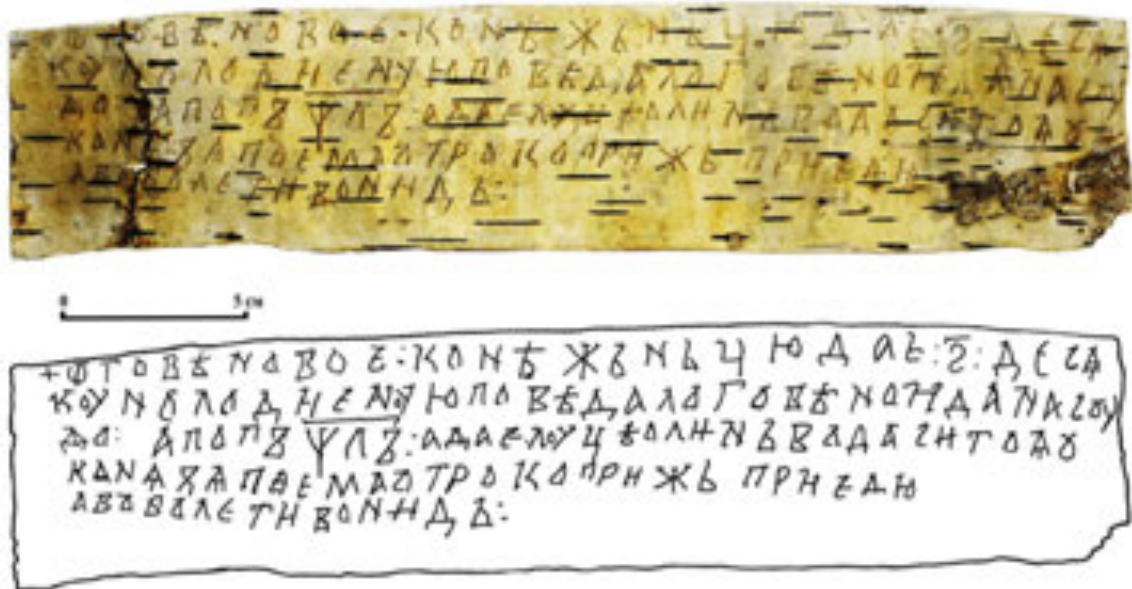
Рис. 3. Фото та авторський пропис звенигородської берестяної грамоти № 2

У день виявлення берестяний сувій піддали пластифікації 1 . Розміри розгорнутої грамоти становлять 6,5×30 см, текст кириличний, із подекуди розділеними словами, записаний у 5 рядків, висота літер варіюється в межах 0,7–1 см [Свешніков, 1990, с. 128] (рис. 3).