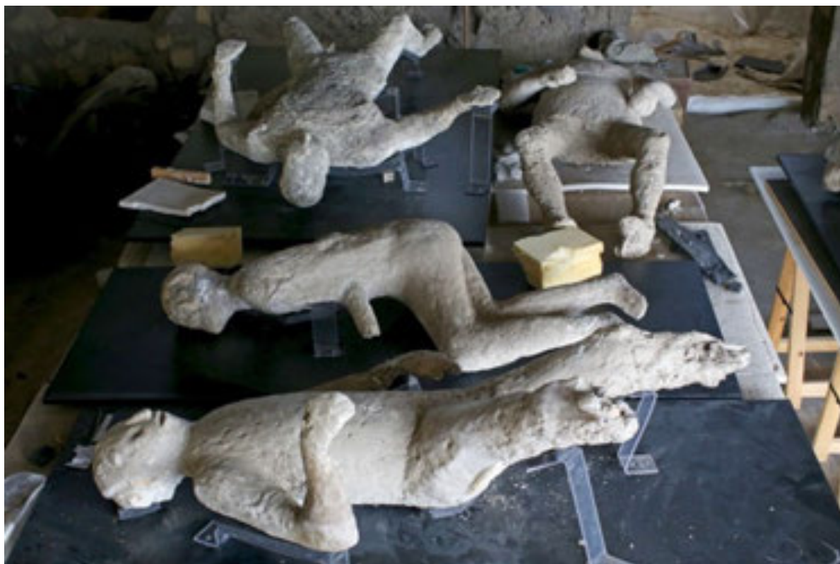
Рис. 3. Гіпсовий зліпок померлих у Помпеях

Однак у випадку з підкурганими похованнями X–XI ст., дія високої температури на людське тіло не обов'язково мала бути прижиттєвою. У судовій медицині наслідки дії полум'я на труп описані так: під дією високих температур тканини зневоднюються, м'язи скорочуються; оскільки для різних їх груп масив м'язової тканини відрізняється, верхні та нижні кінцівки поступово згинаються в суглобах і наближуються до передньої поверхні тулуба, іноді спостерігається вигин тіла в попереку. Таке положення тіла прийнято вважати суто посмертним та називати «позою боксера» чи «позою фехтувальника» [Туманов, Кильдюшев, Соколова, 2011, с. 123]. На археологічному матеріалі така поза найкраще відома завдяки гіпсовим відливкам трупів загиблих у Помпеях (рис. 3) [Prokeš, 2007, s. 32].