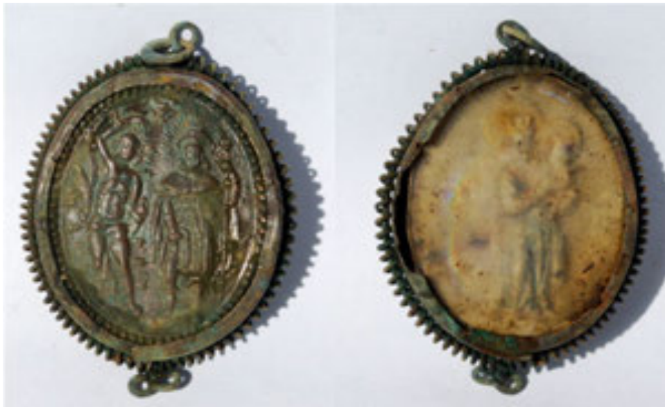
Рис. 1. Релігійний медальйон-каплер. 1 – реверс. Святі Севастіан і Рох; 2 – аверс. Богородиця з Дитятком Ісусом. XVII ст. Вигляд до реставрації

У межах абсиди й більшої частини центрального нефу (досліджено площу 170 м 2 ) нашарування простежено до рівня материка, який місцями залягав до глибини 2,4 м. Верхній шар досліджених ділянок (до 0,4–0,6 м від рівня підлоги церкви) складався винятково із завалу каменю, цегли, будівельного розчину, штукатурки й уламків нервюр від готичного склепіння. Нижче зафіксовано верхівки стін від наявних тут крипт, які різняться розмірами та технікою мурування. Усі поховальні камери виявилися зруйнованими та пограбованими, а останки понищеними. Ділянку в межах крипт заповнено будівельним сміттям, що містило розрізнені людські кістки.