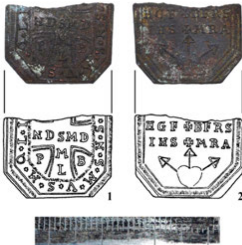
Рис. 7. Фрагмент релігійного медальйона. 1 – аверс. Хрест св. Бенедикта; 2 – реверс. Молитва св. Захарія. XVII ст. (Фото і рисунок В. Мойжес)