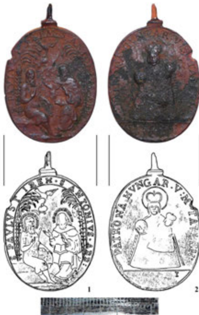
Рис. 6. Релігійний медальйон. 1 – реверс. Святи Антоній і Павло; 2 – реверс. Матір Божа. XVII ст. (фото і рисунок В. Мойжес)

божественне одкровення. Він почув голос, який сповістив, що у відлюдді є пустельник, який досяг вершин самозречення і його треба навідати. Антоній пустився в дорогу. Самітники зустрілися і довго бесідували. Цей момент і відображено на медальйоні.