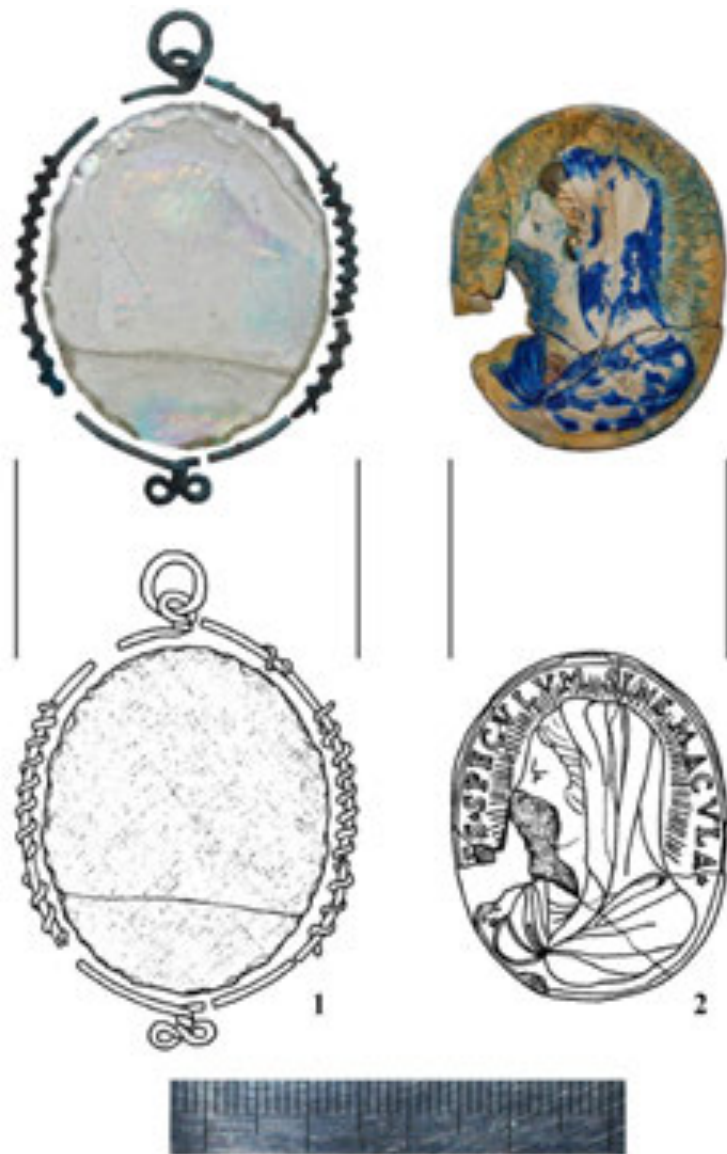
Рис. 3. Фрагменти медальйона-каплера. 1 – скляна шибка аверсу і мосяжна рамочка; 2 – аверс. Матір Божа. XVII ст. (фото і рисунок В. Мойжеса)

Окремий різновид медальйонів репрезентує зразок, виконаний у вигляді тонкої металевої пластини (рис. 7). Збереглася лише нижня половина виробу, але численні аналогії, відомі з теренів Європи, дозволяють якнайдетальніше реконструювати його цілісність. Технологічна відмінність цього зразка від розглянутих – те, що двосторонні рельєфні зображення нанесено за допомогою штампа. В основі іконографії – написи, точніше їх скорочення. Спосіб написів представлено двояко: в одному випадку (на аверсі) окремі літери – це заголовні букви слів, у