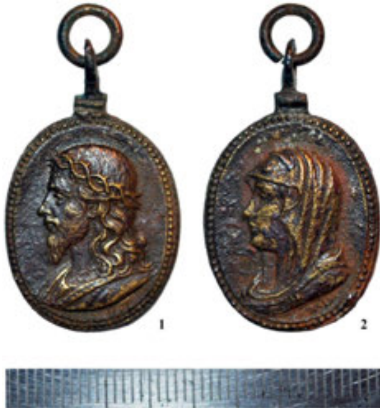
Рис. 4. Релігійний медальйон. 1 – аверс. Христос; 2 – реверс. Матір Божа. XVII – перша чверть XVIII ст.

присутність образу Богородиці на ньому закономірна. Адже в середньовіччі, крім святих, за допомогою у подоланні мору зверталися до Матері Божої Милостивої й Матері Божої Милосердної. Цікаві в цьому контексті т. зв. чумні стовпи, які досі збереглися у численних містах Центральної та Західної Європи. Їх встановлювали впродовж XVII–XVIII ст. на честь подолання епідемій. Один із найдавніших відомий у Мюнхені (1638). Вершину колон дуже часто вінчала фігура Матері Божої, переважно в образі Пречистої Діви Непорочного Зачаття (Іммакулати). Ймовірно, що розглядуваний медальйон також мав аналогічне призначення.