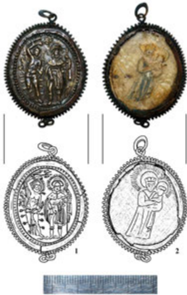
Рис. 2. Релігійний медальйон-каплер. 1 – реверс. Святи Севастіан і Рох; 2 – аверс. Богородиця з Дитятком Ісусом. XVII ст. Вигляд після реставрації (фото і рисунок В. Мойжес)