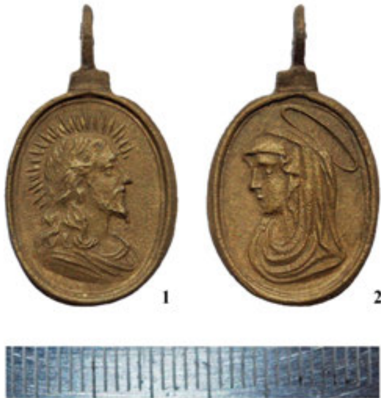
Рис. 5. Релігійний медальйон. 1 – аверс. Христос; 2 – реверс. Матір Божа. Перша чверть XVIII ст.