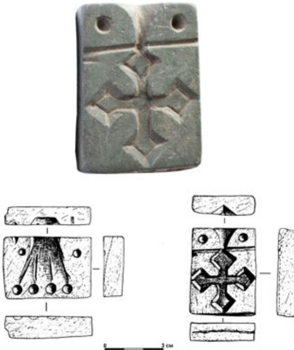
Рис. 2. Львів. Кам'яна форма XIII ст. Fig. 2. Lviv. Stone form of XIII century

Беззаперечним доказом місцевого виготовлення металевих хрестиків служать знахідки кам'яних ливарних формочок зі Львова та Щекотина. Двосторонню формочку з Щекотина виготовлено з мергелястої крейди. Її використовували для відливання хрестиків і художніх нашивок у вигляді «рогу достатку». Виготовлену з місцевої сировини, цю формочку з недосконало вирізаними зображеннями автор досліджень датував досить неоднозначно («не раніше XI ст.») [Чайка, 2003, с. 19–20, рис. 4, 7].