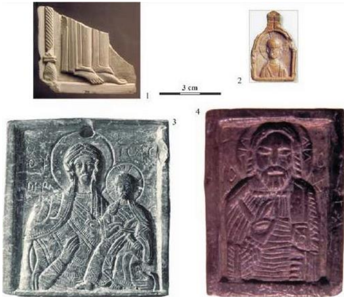
Рис. 4. Кам'яні іконки з Верхньої Надбужанщини. 1, 3 – Волинь; 2 – Белзець; 4 – Червен (за Wołoszyn 2012)