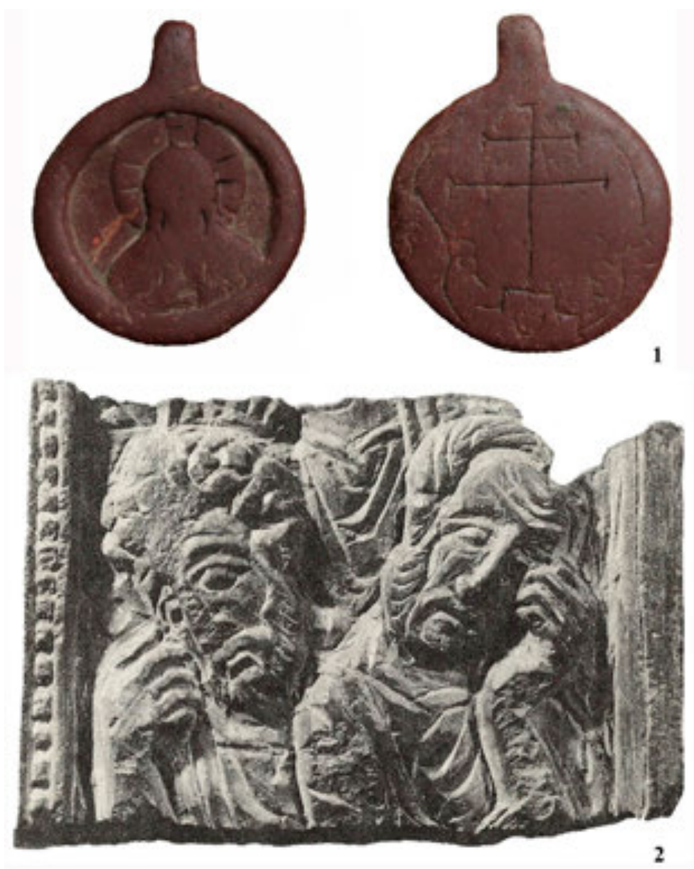
Рис. 5. Шиферні іконки зі Звенигорода (1 – за Петегирич, Оприск, Закалик, 2009; 2 – за Свешніков, 1987)