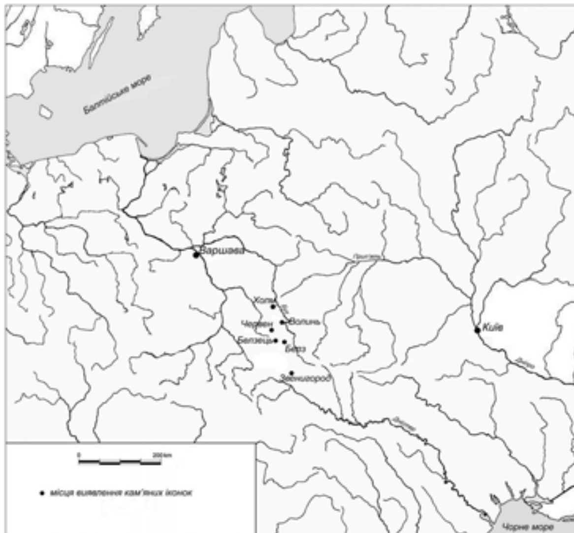
Рис. 3. Карта-схема поширення кам'яних іконок на території Верхньої Надбужанщини Fig. 3. Schematic map of spreading of stone icons on the territory of Upper Bug region

формочки. Одна двобічна формочка-матриця використовувалася для відливання рівносторонніх хрестиків (3,4×3,4 см) із ромбічно розширеними кінцями з одного боку та чотирьох кульок діаметром 0,4–0,45 см на другому (рис. 2).