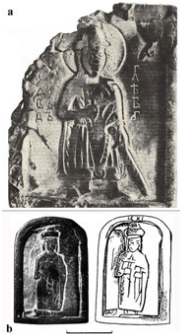
Рис. 8. Кам'яні іконки з Таманського півострова (а – за Николаева, 1983) і Білоозера (б – за Макаров, Захаров, 1995)