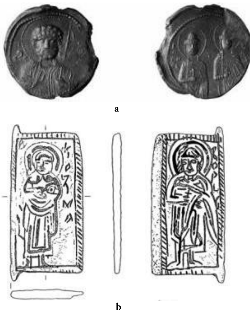
Рис. 7. Червен. а – печатка князя Ярополка Ізяславовича; б – стулка металевої іконки-складня (за Мусин, 2012)

схематично, перехресть руків'я не видно, чітко простежуються тільки їх дисковидні наверхники, що є типовою ознакою мечів XIII і наступних століть [Кирпичников, 1966, с. 54].