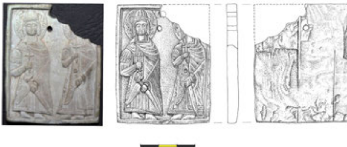
Рис. 6. Борисоглібська іконка з Белза (рисунок І. Принади) Fig. 6. Borys-and-Glib icon from Belz (figure by I. Prynada)

якого не має зазначеного підвищення, де, власне, й була знайдена іконка [див.: Чачковський, 2004, с. 150, рис. 1]. Таку ж картину можна побачити на картах XIX ст.