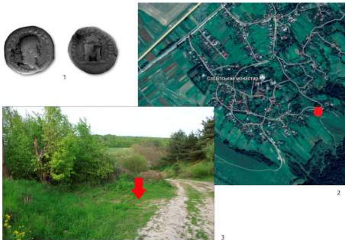
Рис. 1. Місце знахідки скарбу у с. Словіта (1 – на Google Maps; 2 – фото Н. Демського, 2023) та монета Тита (3) з нього (фото без масштабу)

Депозит, імовірно в кілька сотень монет, було випадково виявлено на початку 1975 р. під час розширення дороги на південно-східній околиці села, в ур. За копані (рис. 1, 2). Місце знахідки розташоване на північному схилі пагорба висотою близько 380 м н. р. м., який прилягає до прокладеної біля нього дороги (рис. 1, 3). Перші свідчення про скарб опубліковані в короткому повідомленні «Подарок римського імператора» («Подарунок римського імператора») у газеті «Труд», у номері від 25 лютого 1975 р., тобто практично відразу після його відкриття [Чернобров, 1975]. У тексті короткої замітки міститься інформація, що скарб нібито знайшов тракторист колгоспу ім. 17 вересня Ярослав Кіндрат під час проведення земляних робіт у Золочівському р-ні (без зазначення назви населеного пункту). Вказано також кількість монет – 500 шт., датованих часом імператора Веспасіана [Чернобров, 1975]. Повний зміст замітки повторно опубліковано 2000 р. у праці Владислава Кропоткіна із приміткою, що монети зберігаються у краєзнавчому музеї м. Золочева [Кропоткин, 2000, с. 51, № 2275]. Однак треба зауважити, що в 1970-х роках музею у Золочеві ще не існувало.