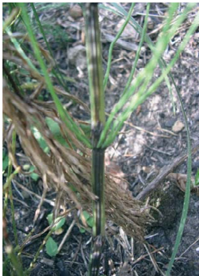
Рис. 1. Искусственное заражение хвоща полевого штаммом Pseudomonas syringae Б-101.