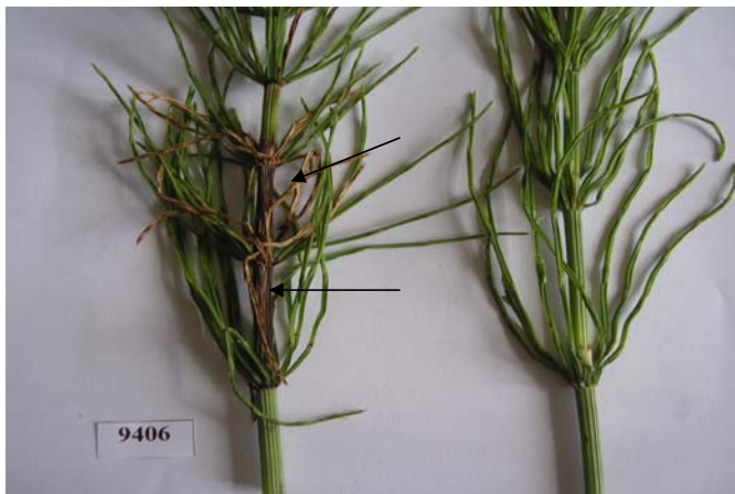
Рис. 3. Поражение полевого хвоща при искусственной инокуляции P. syringae pv. atrofaciens 9406