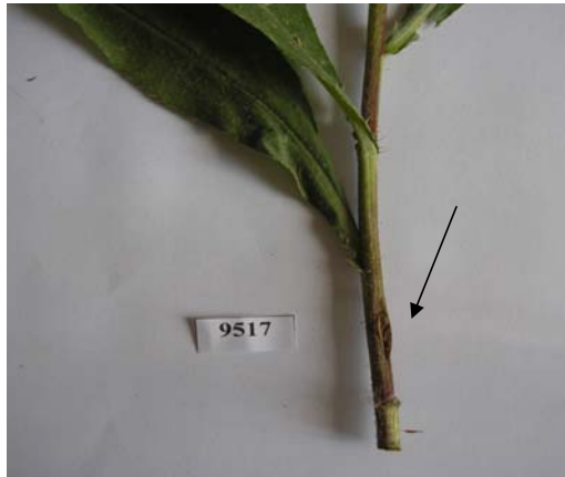
Рис. 2. Искусственное заражение осота P. syringae pv. atrofaciens 9517