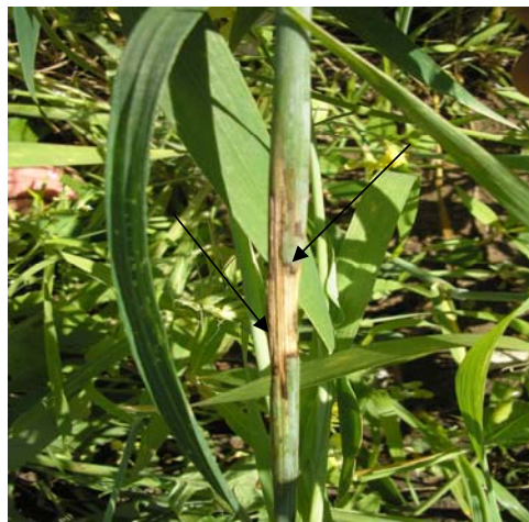
Рис. 1. Пятнистость стебля пшеницы (с. Ранняя 93) вследствие искусственного заражения P. syringae pv. atrofaciens

Все изоляты представляли собой грамотрицательные подвижные палочки, на лакмусовой сыворотке образуют щелочь, пептонизируют молоко, образуют флуоресцирующий пигмент, не образуют индола и сероводорода, подавляющее их большинство – разжижают желатин (табл. 2). Выделенные изоляты бактерий в аэробных условиях используют как единственный источник углеродного питания глюкозу, маннозу, арабинозу, сахарозу, маннитол, сорбитол, инозитол, и не ферментируют лактозу, рамнозу, дульцитол, салицин, инулин, мальтозу. Некоторые изоляты бактерий отличались по способности использовать сахарозу, рамнозу, сорбитол, инозитол, что можно отнести за счет штаммовых различий. Так, изолят 9433 отличался от других тем, что не ферментировал сахарозу и сорбитол, а 9443 образовывал слабую кислоту на рамнозе и раффинозе, но не использовал сорбитол. Изоляты 9489 и 9507 не ферментировали раффинозу и маннитол, а изоляты 9481, 9482, 9484 – раффинозу и инозитол.