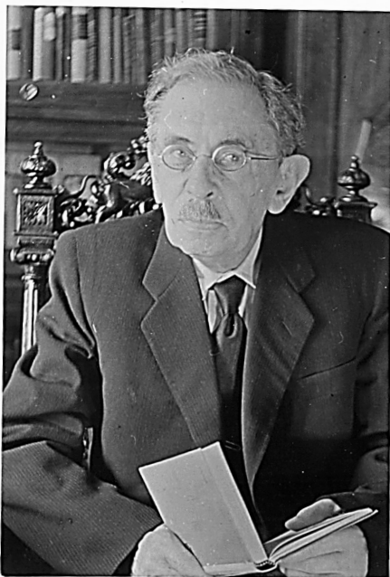
Фото 1. Академік АН УРСР В.Г. Дроботько (1961 р.)

Про Віктора Григоровича вже написано чимало статей. А в 2007 році Ю.М. Береговою під керівництвом професора С.П. Рудої була захищена кандидатська дисертація з історії науки на тему: «Діяльність В.Г. Дроботька у контексті розвитку мікробіологічної науки в Україні».